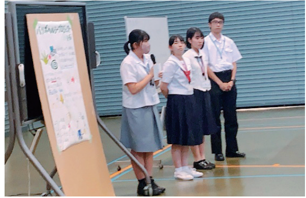
(活動計画発表の様子)