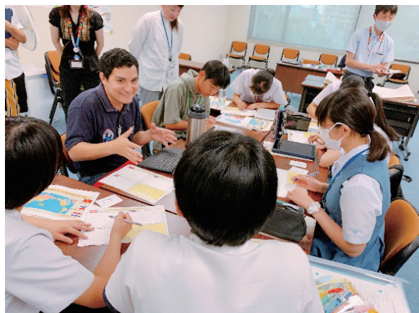
(JICA 研修員へのインタビュー)