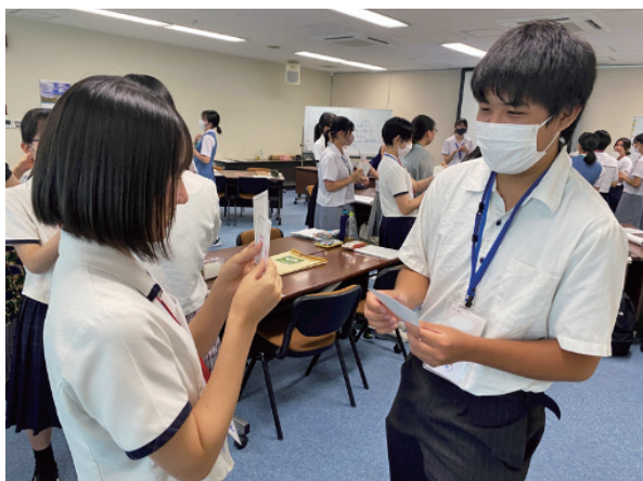
(アイスブレイクの様子)