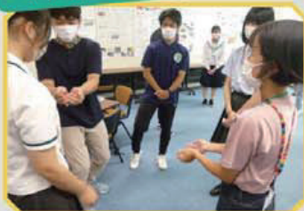
・アイスブレイク・