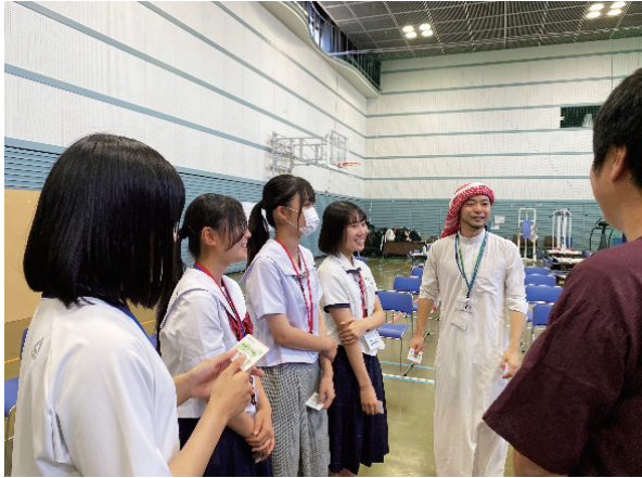
(言葉の背景等を説明する国際協力推進員)