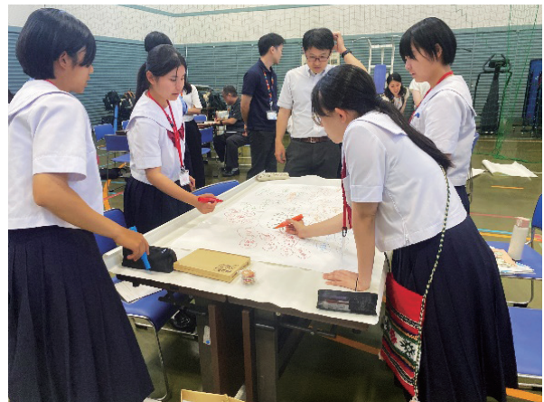
(ウェビングに追加記入)