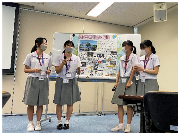
(学校新聞を用いた学校紹介)