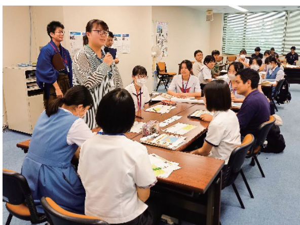
(インタビュー内容発表の様子)