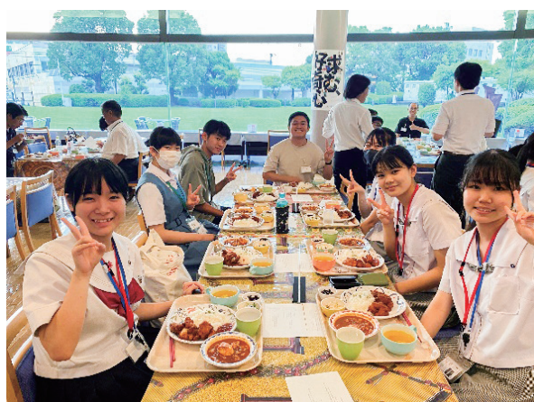
(エスニック料理を囲み交流)