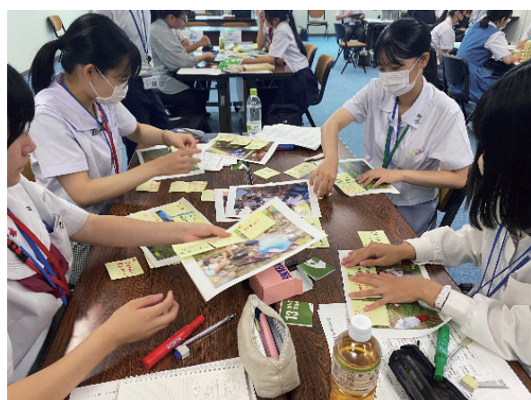
(村の写真をもとにフォトランゲージ)