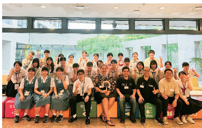
(JICA 研修員との集合写真)