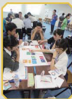
・国際協力計画作り・