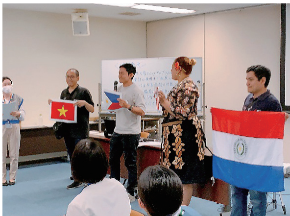
(JICA 研修員の自己紹介)