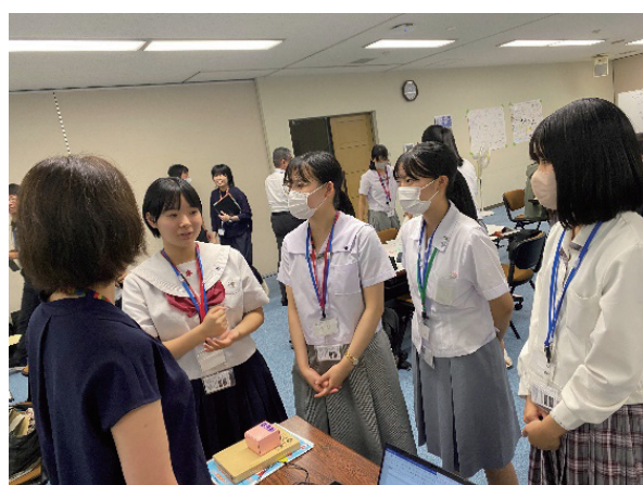
(企画調査員への相談)