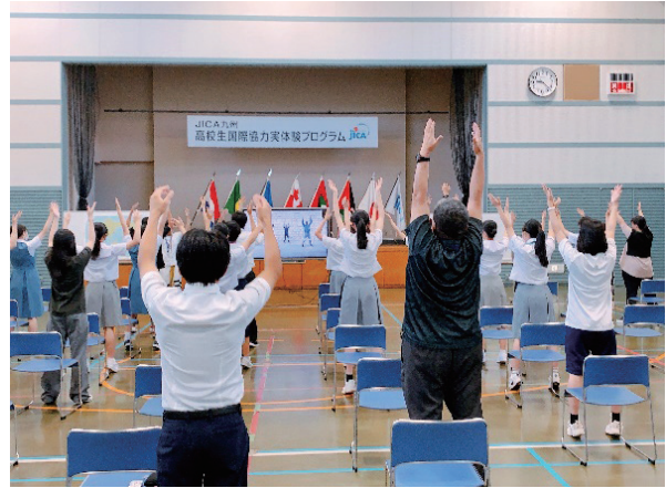
(ウォームアップ体操の様子)