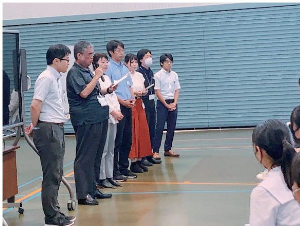
(各校教員からのフィードバック)