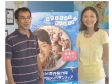
海外ボランティアの興味深い話を、たくさん聞くことができますよ。