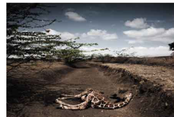
第6回DAYS国際フォトジャーナリズム大賞1位「ケニアの干ばつ」ステファノ・テルイジ(イタリア/VII Network)

衝撃的な写真が今年の春、世界的なフォトジャーナリズム誌DAYS JAPANにより発表されました。ケニアの干ばつで干からびたように死んだキリンの一枚。日本にいる私たちには想像のつかない現実が、今、地球で起きています。世界各地で起こっている資源獲得競争による環境破壊、それにより引き起こされる紛争と貧困、気候変動による自然の変化、軍事衝突など世界各国のジャーナリストから寄せられた選りすぐりの報道写真をDAYS JAPANのご協力により開催します。地球の今を見つめ、地球にとってより良い未来を思い描く機会となることを願っています。