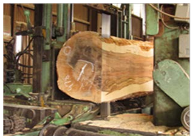
(右)当社の実際の製材風景

※「中小企業海外展開支援事業～普及・実証事業～」は、我が国の中小企業などの製品・技術が途上国の開発に有効であることを実証するとともに、現地での適合性を高め、普及を図ることを目的とするものです