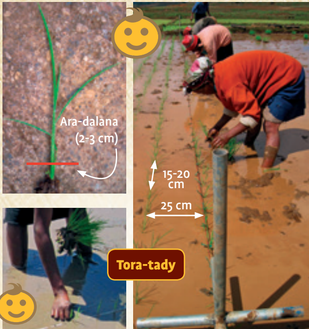
Ara-dalana (2-3 cm)