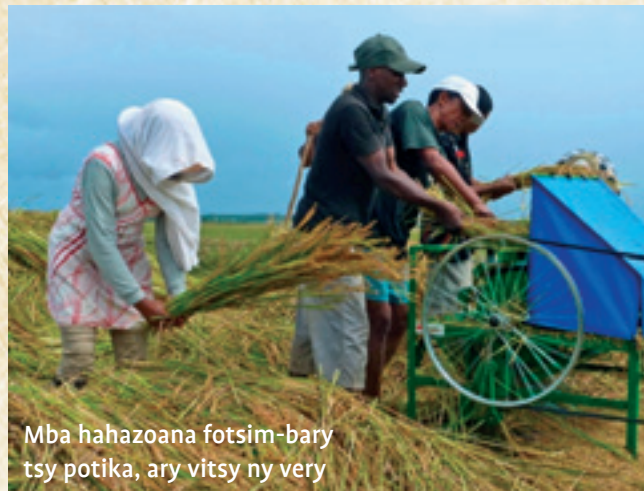
Mba hahazoana fotsim-bary tsy potika, ary vitsy ny very