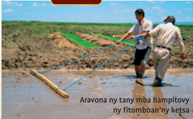
Aravona ny tany mba hampitovy ny fitomboan'ny ketsa