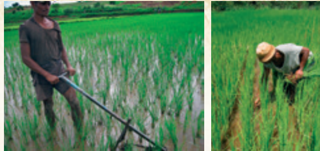
Ny fiavana voalohany atao amin'ny milina