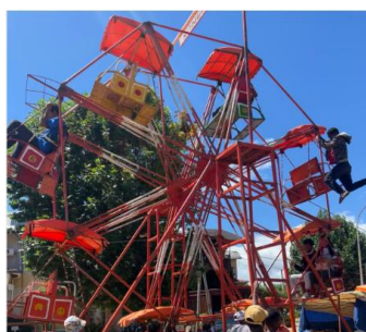
お兄さん(右上)がぶら下がって動かしてます