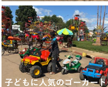
子どもに人気のゴーカート