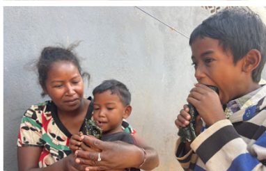
巻き寿司は子どもたちにも人気！