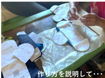
作り方を説明して...