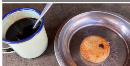
←約9円で食べられるおやつ