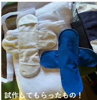
試作してもらったもの！

若年妊娠による退学も多く、マダガスカルに来てからずっとやりたかった 性教育 。言葉の壁もあり伝え方や表現が難しく、協力してくれるマダガスカル人がなかなか見つからずに行き詰まっていた。そんな時、同じ任地の隊員が 布オムツ の作製に挑戦するとのことで、性教育の取っ掛かりにでもなればなあと、 布ナプキン の作製をはじめました！