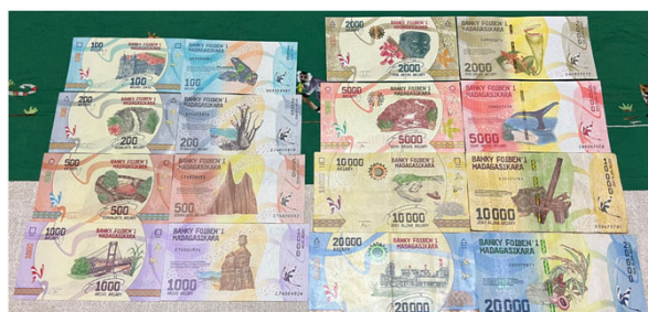
現在使用されている紙幣。王宮や国立公園、キツネザル、伝統工芸品などの図柄になってます

ちなみに、道で売られているおやつ 1個100アリアリ と コーヒー1杯200アリアリ は約 9円 ほどで楽しめます。