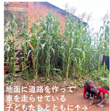
地面に道路を作って 車を走らせている 子どもたちとともに↑

マダガスカルは徐々に暑さが落ち着き、雨が降る日も少なくなってきました。任地の農地では最近、背の伸びたトウモロコシが至るところで存在感を出しています。私の腰の高さほどだったトウモロコシの茎が、1週間後には身長を遙かに越して、植物の成長力とたくましさを感じます！