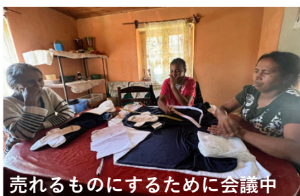
売れるものにするために会議中

村で話を聞くと、紙ナプキンは高価で使用する人は0に近く、布ナプキンの存在を知らない人が大多数でした。活動をに共する保健ボランティアさんやお母さんからの反応は良く、 防水布 を使用した試作品を触ってみてもらおうと、あったら使いたいと前向きな意見が多く出ました。現在は自分の帰国後にも 布ナプキンの作製・販売・普及 が続くことを目指して、組み合わせのよい布や布の枚数、サイズ感など、協力してくれる仕立屋さんとともに試行錯誤しています。