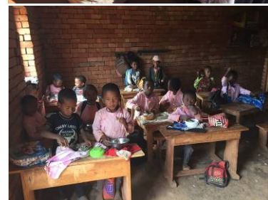
写真上: 休み時間にお菓子を購入する生徒たち

会(活動発表会)で入賞した私立学校の校長先生に活動内容についてインタビューを行いました。幼稚園生～高校生までが通う学校で子どもに人気のお菓子を 校長先生自ら手作りし毎日販売 しています。材料の分量や味は試行錯誤の上のオリジナルレシピです。その 販売益で機械を購入 し、生産量をアップさせました！今年にはさらに 学校給食用の大きな鍋を購入し、子どもたちが温かい給食を食べられるようにすることが目標 だそうです。