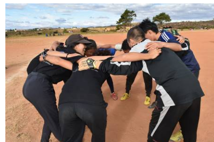
日本チーム試合前の気合の円陣

昨年に続き、ミアリナリブにて隊員が日本祭りを開催しました。今回の特徴は「 スポーツ 」。日本文化、隊員活動紹介に加えて、 サッカー、バスケの親善試合 を実施しました。親善試合は原則 全員参加 。皆で交流することが大事！ということで、マダガスカルチームも日本チームも 男女混合 、3分したら交代OKという条件で、私も15年以上振りに試合に参加。（ボール怖かった…笑）地域の青少年のサッカー・バスケチームの指導をしている同期隊員の強みがとても活かされたお祭りだったと思います！