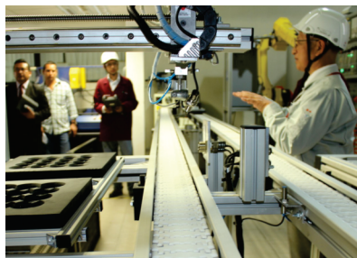
Un voluntario explicando sobre la automatización manufacturera