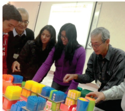
Un voluntario explicando sobre el método 5S