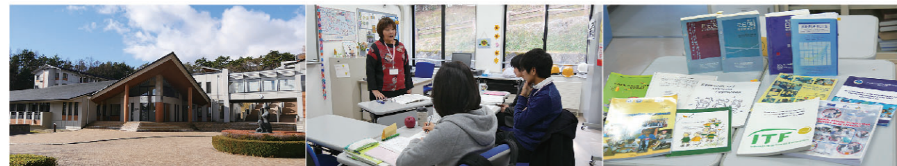
ЖАЙКА-гийн сайн дурын ажилтнууд Монгол улсад томилогдохоос өмнө сургалтад хамрагддаг Нихонмацу дахь сургалтын төв