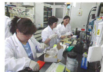
Монгол мэргэжилтнүүд Японд сургалтанд хамрагдаж буй байдал