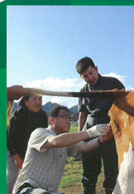
ЖАЙКА-гийн нөхөн үржихүйн мэргэжилтэн үзлэг хийж буй нь