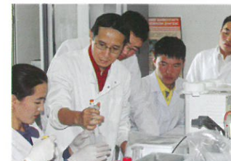
ЖАЙКА-гийн микробиологийн мэргэжилтэн оюутнуудад хичээл өрж буй нь