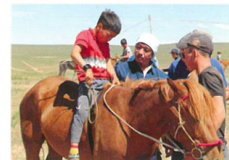
ЖАЙКА-гийн адууны тунуур хөдөлгөөний системийн мэргэжилтэн зүрхний бичлэлийн багаж ашиглан үзлэг хийж байна