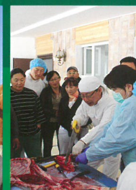
ЖАЙКА-гийн эмгэг судлалын мэргэжилтэн задалан хийж үзүүлж байна