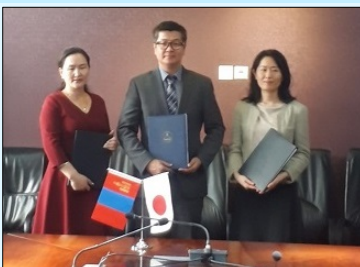
Бэлтгэл судалгааны санамж бичигт гарын үсэг зурах ёслол

ЖАЙКА 1999 оноос хойш монгол улсад сургуулийн барилга барих, өргөтгөх дөрвөн шатны төсөл хэрэгжүүлэн нийт 40 мянган хүүхэд суралцах сургуулийн барилга байгууламж барьсан байдаг. Гэвч нийслэл хотын хүн ам хурдацтай өсч буй улмаас харьяаллын бус сургуульд суралцах, олон ээлжээр хичээллэх асуудал болон сургуулийн барилга олон шаардлага хангасан байх шаардлагатай болж буй зэрэг шийдэгдээгүй асуудал байсаар байна. Ийм нөхцөл байдалд үндэслэн буцалтгүй тусламжаар “Улаанбаатар хотод ЕБС барих төсөл”-ийн бэлтгэл судалгааг хэрэгжүүлэв. Энэхүү судалгааны явцад өнөөгийн боловсролын барилга байгууламжид тулгарч буй асуудлууд, тухайлбал хөгжлийн бэрхшээлтэй хүүхдэд ээлтэй орчин бүрдүүлэх, гамшгийн үед сургуулийн барилгыг түр хоргодох байрны зориулалтаар ашиглах боломж хязгаарлагдмал байгааг тодруулав. Цаашид эдгээр асуудлыг шийдвэрлэх арга замыг тусгасан сургуулийн барилга барих шаардлага тавигдаж байгаа юм. Энэхүү төслийн хүрээнд дээрх хэрэгцээ шаардлагыг хангах “Загвар” болохуйц, өндөр чанартай сургуулийн барилга барихыг зориж байна.