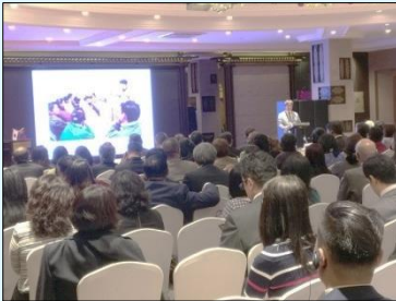
Ёслолын ажиллагааны үеэр илтгэл тавьж буй анхны сайн дурын гишүүн

Монгол улс дахь ЖАЙКА-ийн сайн дурын хамтын ажиллагааны 25 жилийн ойд зориулсан ёслолын арга хэмжээ 9 сарын 29-ний өдөр боллоо. 1992 оны 4 сард анхны 2 залуу сайн дурын гишүүн томилогдон ирснээр Монгол дахь ЖАЙКА-ийн сайн дурын хамтын ажиллагаа эхэлсэн бөгөөд өнөө хүртэл нийт 650 сайн дурын гишүүн боловсрол, эрүүл мэнд, спорт зэрэг олон салбарт амжилттай ажиллаж ирсэн байна. Ёслолын арга хэмжээнд Эрүүл мэндийн сайд А.Цогцэцэг, Япон улсын Элчин сайд Такаока нарын хүндэт зочдоос гадна сайн дурын гишүүд, тэднийг хүлээн авсан байгууллагын төлөөлөл зэрэг 200 гаруй хүн оролцлоо. Ёслолын арга хэмжээний үеэр 25 жилийн түүхийг хүүрнэсэн богино хэмжээний кино үзүүлж, үе үеийн сайн дурынхан үйл ажиллагаагаа танилцуулсан бол хэлэлцүүлгийн үеэр 25 жилийн түүхэн замнал ба ололт амжилтыг эргэн харж, хоёр орны хоорондын өвсний үндэс хөтөлбөрийн түвшний хамтын ажиллагаа болох сайн дурын гишүүн илгээх хамтын ажиллагаа нь Монгол улсын хөгжилд хувь нэмэр оруулж ирсэнийг тодотгов. ЖАЙКА-ийн сайн дурын гишүүд цаашид ч цаг үе ба нийгмийн өөрчлөлтөд уян хатан зохицож, монголчуудтай хамт шинэ зам гаргаж явах болно.