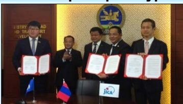
Гарын үсэг зурах ёслол

9 сарын 22-нд Зам, тээврийн хөгжлийн сайд Д.Ганбат байлцан тус яам, НЗДТГ, ЖАЙКА-ийн хооронд “Улаанбаатар хотын нийтийн тээврийн дизель хөдөлгүүртэй шугамын автобусанд хорт утаа шүүгч (DPF) суурилуулан, хөө тортогийн ялгарлыг бууруулах туршилтын төсөл”-ийн санамж бичигт гарын үсэг зурав. Энэхүү төслийн хүрээнд Японы Комотек компаний үйлдвэрлэсэн хорт утаа шүүгчийг (DPF) Улаанбаатар хотын төвийн шугамын автобусанд тавих, ашиглалтын тогтолцоог нэвтрүүлэх, туршилтын төсөл хэрэгжүүлэхтэй холбоотой асуудлуудыг судлах юм. Тус компаний хорт утаа шүүгч нь (DPF) төслийн урьдчилсан судалгаагаар Улаанбаатар хотын агаарын бохирдлыг бууруулахад үр нөлөөтэй болох нь тогтоогдсон бөгөөд монголд бизнесийн үйл ажиллагаа эрхлэн агаарын бохирдлыг бууруулахад хувь нэмэр оруулна гэж найдаж байна.