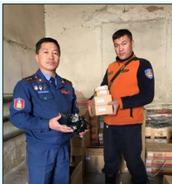
Нийлүүлсэн сэлбэг хэрэгсэл

байгаатай холбогдуулан ЖАЙКА ОУБ-аас Follow-up буюу төслийн дараах хамтын ажиллагаа хэрэгжүүлэн оригинал сэлбэг хэрэгсэл нийлүүлэх шийдвэр гаргасан. Энэ төслөөр худалдан авсан сэлбэг хэрэгслийн эхний хэсгийг оны 10 сарын 18-ны өдөр НОБГ-т хүлээлгэн өгсөн бөгөөд шаттай машины тоног төхөөрөмж болон бусад сэлбэг хэрэгслийг 11 сард нийлүүлж, 12 сарын эхээр хүлээлгэн өгөх ёслолын арга хэмжээ зохион байгуулахаар төлөвлөн ажиллаж байна.