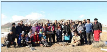
Мод тарихад оролцсон холбооны гишүүд

10 дугаар сарын 14-ний өдөр ЖАЙКА-ийн сургалт төгсөгчдийн холбооны санаачлагаар байгаль орчныг хамгаалах, ногоон байгууламжийг нэмэгдүүлэх зорилгоор Улаанбаатар хотын Агропарк мод тарих үйл ажиллагаа зохион байгууллаа. Энэ өдөр тус холбооны 53 гишүүн мэргэжлийн байгууллагын зааварчилгааны дагуу шар хуайс, гүйлс, чацаргана зэрэг 120 бутлаг суулгац тарив. Агропарк нь харуул манаатай, худагтай, модоо байнга услах боломжтой байдаг тул мод тарихаар тус паркийг сонгож авсан. Мөн тус паркийн урд талд байрлах ногооны талбайг ямарваа нэг байгалийн гамшгаас хамгаалах үр нөлөөг ч тооцсон байна.