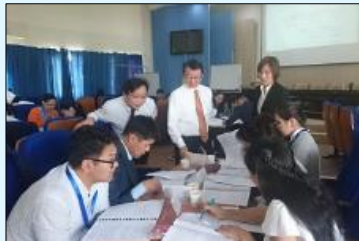
Олон улсын татвар ногдуулалтын ахисан түвшний сургалт

2017 оны 4 сараас “Монгол улсын татварын албаны татвар хураалтын үйл ажиллагаа болон олон улсын татварын асуудлыг боловсронгуй болгох төслийн” 2-р шат хэрэгжиж эхлээд байна. Олон улсын татвар ногдуулалтын салбарт монгол улсын төсвийн эх үүсвэрийг баталгаажуулах, олон улсын хамтын ажиллагааг байвал зохих хэмжээнд нь хүргэх зорилгоор ТЕГ-ын зохион байгуулалтын бүтцийг бэхжүүлэх, байцаагч нарын хууль хэрэгжүүлэх чадавхийг дээшлүүлэхэд дэмжлэг үзүүлж байна. Монгол улсын Засгийн газар, 2017 оны 5 сард ОУВС-аас баталсан өргөтгөсөн санхүүжилтийн хөтөлбөрийн хүрээнд Татварын ерөнхий хуульд нэмэлт өөрчлөлт оруулах бэлтгэл ажлыг хийж байна. Энэхүү төслийн хүрээнд эдгээр хууль тогтоомжуудад өөрчлөлт оруулахтай холбоотой зөвлөмж өгч байгаа бөгөөд энэ оны 6-р сараас татварын ерөнхий хууль зэрэг хууль тогтоомжид өөрчлөлт оруулахад чиглэсэн СЯ болон ТЕГ-ын хамтарсан ажлын хэсэгтэй тогтмол хэлэлцүүлэг хийж байна. 9 сард олон улсын татвар ногдуулалтын чиглэлээр ирээдүйд удирдах ажилтанууд болох улсын байцаагч нарт зориулан “Олон улсын татвар ногдуулалтын ахисан түвшний сургалт” (Transfer price taxation үнэ шилжүүлэлтийн татвар ногдуулалт) ыг зохион байгуулав.