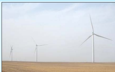
Говьд боссон салхин цахилгаан үүсгүүрийн турбинууд.

10 сарын 6-ны өдөр Өмнөговь аймгийн Цогтцэций суманд 50 мегаваттын хүчин чадалтай салхин цахилгаан станц ашиглалтад орж нээлтийн ёслол боллоо. ЖАЙКА-ийн сэргээгдэх эрчим хүчний салбарт хийж буй анхны долларын санхүүжилт бөгөөд (ЕСБХБ-тай хамтран олгосон зээл) Монголын “Ньюком” групп болон Японы Софт банкны “Эс Би энержи” компанийн хамтарсан хөрөнгө оруулалттай “Клин энержи Ази” компанид олгож буй төсөл юм. Энэхүү цахилгаан станц нь говийн бүс нутаг дахь анхны салхин цахилгаан станц бөгөөд Монгол Улсын эрчим хүчний хангамжийн найдвартай байдлыг хангах, сэргээгдэх эрчим хүчийг нэвтрүүлэхэд ихээхэн хувь нэмэр оруулах юм. ЖАЙКА нь Монгол Улсын эрчим хүчний салбар дахь хамтын ажиллагаагаа үргэлжлүүлж, нийгэм, эдийн засгийн тогтвортой хөгжилд дэмжлэг үзүүлэх чиглэл баримтлан ажиллаж байна.