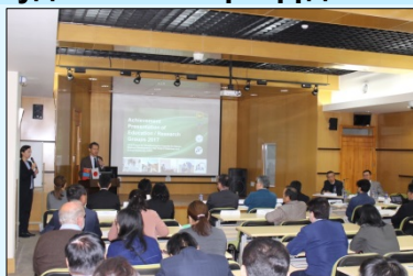
Үр түнгээ танилцуулж буй байдал

Техникийн хамтын ажиллагааны “Мал эмнэлэг, МАА-н салбарын хүний нөөцийн хөгжлийн чадавхийг бэхжүүлэх төсөл”-ийн хүрээнд 2016 оны 5 сараас мал эмнэлгийн чиглэлийн 4 байгууллага (ХААИС-ийн мал эмнэлэгийн сургууль, Мал эмнэлгийн хүрээлэн, Мал эмнэлгийн төв лаборатори, Нийслэлийн мал эмнэлгийн газар) хамтран ажиллаж, 8 сургалт, судалгааны баг байгуулсан байна. Энэ төслийн хүрээнд нээлттэй зарлаж, сонгон шалгаруулсан өргөн хүрээтэй сургалт, судалгааны сэдвээр (гахайн шүлхий, адууны ям зэрэг халдварт өвчин, үнээний фермд үржлийн технологи нэвтрүүлэхэд чиглэсэн мал эмнэлгийн үйлчилгээг сайжруулах зэрэг) явагдаж буй судалгааны ажилд зориулан тоног төхөөрөмж, хэрэглээний зүйлсийг нийлүүлэн, дэмжлэг үзүүлж ирлээ. 10 сарын 12-ны өдөр эдгээр сургалт, судалгааны ажлын үр дүнг танилцуулах хурал болж, бүлэг тус бүр үйл ажиллагааныхаа үр дүнг тодотгож, энэхүү үйл ажиллагааг цаашид үргэлжлүүлэхийн ач холбогдлыг тодруулав. Энэхүү төслийн хүрээнд цаашид сургалт судалгааны үйл ажиллагаанд дэмжлэг үзүүлэхийн хамт малын эмч нарын мэргэжил дээшлүүлэхэд анхаарах зорилт тавьж байна.