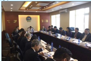
Хамтарсан зохицуулах хорооны хурал

“Улаанбаатар хотын Олон улсын нисэх онгоцны шинэ буудлын хүний нөөц, ашиглалт, менежментийн чадавхийг сайжруулах төсөл”-ийн Хамтарсан зохицуулах хорооны 5-р хурал хуралдав.