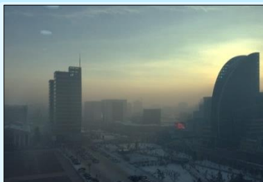
Агаарын бохирдолтой Улаанбаатар хот

Улаанбаатар хотод өвлийн улиралд гэр хорооллын нүүрсний утаа болон автомашинаас ялгарах хаягдал хийн улмаас агаарын бохирдол дээд цэгтээ хүрдэг. PM2.5, PM10 тоосонцор, хүхрийн хий (Sox), азотын хий (Nox) зэрэг агаар бохирдуулагч бодисын нягтрал нь монгол улс болон ДЭМБ-ын байгаль орчны стандартаас хэд дахин давж, ард иргэдийн эрүүл мэндэд хохирол учруулж байгаа нь санаа зовоосон асуудал болоод байна. Ийм нөхцөл байдалд УИХ 1 сарын 12-ны өдөр Агаарын тухай хууль болон холбогдох хуулиудад нэмэлт өөрчлөлт оруулан шинэчлэн баталлаа. Энэ удаагийн нэмэлт өөрчлөлтөд агаарын бохирдлыг бууруулах сан байгуулах, уг сангийн хөрөнгийг ашиглан сайжруулсан түлшний технологи, үйлдвэрлэлийг санхүүжүүлэх, барилга байгууламжийн дулаалгыг сайжруулах, төвлөрсөн дулаан хангамжийн дэд бүтцийг байгуулахаас гадна цахилгаан халаагуурыг татвараас чөлөөлөх зэрэг арга хэмжээг тусгасан байна. Иргэд агаарын бохирдлын эсрэг үр нөлөөтэй арга хэмжээ авахыг шаардан жагсаал цуглаан хийж буй энэ үед засгийн газар болон Улаанбаатар хот бодит үр дүнтэй арга хэмжээ авч хэрэгжүүлж чадах эсэх нь анхаарал татаж байна.