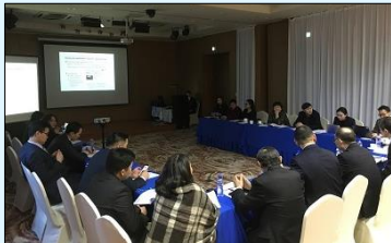
Хамтарсан зохицуулах хорооны анхдугаар хуралдаан

1 сарын 16-ны өдөр Монголын талаас БОАЖЯ болон Байгаль орчин уур амьсгалын сан хариуцан хэрэгжүүлж буй “Хүлэмжийн хийн тооллого хийх чадавхийг бэхжүүлэх замаар үндэсний хүлэмжийн хийн тооллогын мөчлөгийг тасралтгүй сайжруулах нь” төслийн Хамтарсан зохицуулах хорооны анхдугаар хуралдаан болов. Энэхүү төсөл нь монголын засгийн газрын уур амьсгалын өөрчлөлтийн талаарх арга хэмжээнд ач холбогдол өсч буй нөхцөл байдалд хүлэмжийн хийн тооллогын системийг бий болгох чадавхийг дээшлүүлэх зорилгоор хэрэгжиж байгаа юм. Хамтарсан зохицуулах хорооны хуралдаан дээр төслийн үр дүн, үйл ажиллагааны агуулгын талаар санал солилцож, холбогдох талууд үйл ажиллагааны төлөвлөгөөгөө тохиролцож монгол,япон хоёр тал хамтран ажиллаж хэрэгжүүлэх эрмэлзлээ нотлов. Мөн хамтарсан зохицуулах хорооны хуралдааны дараа энэхүү төслийн хэрэгжүүлэх байгууллагууд, донорууд, ТББ,судалгааны байгууллагууд оролцсон Workshop семинар болж, хүлэмжийн хийн талаар мэргэжлийн хэлэлцүүлэг хийж, санал солилцов.