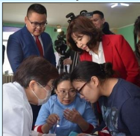
Үзлэг оношилгооны явцтай танилцаж буй Эрүүл мэндийн сайд Д.Сарангэрэл

Өвсний үндэс Техникийн Хамтын Ажиллагаа “Монгол хүүхдүүдийн шүдний цоорлоос урьдчилан сэргийлэх төсөл”-ийн хүрээнд амны хөндийн үзлэг хийв.