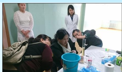
24 цаг шээс хуримтлуулах аргын зааварчилгаа өгч

3 сарын 14,15-ны өдөр өвсний үндэс ТХА “Дархан аймагт амьдралын буруу хэвшлээс үүдэлтэй өвчлөлийн эрүүл мэнд, эмнэлгийн тусламжийг сайжруулах төслийн хүрээнд ( хэрэгжүүлэгч байгууллага: Мито Сайсэйкай Нэгдсэн Эмнэлэг) урьдчилан сэргийлэх эпидемиологийн мэргэжилтний зүгээс эмч, сувилагч нарт биед авч буй давсны хэмжээг зөв тодорхойлох 24 цагийн турш шээс хуримтлуулах аргын талаар сургалт явууллаа. Монголд хоолны давсны хэрэглээ их байгаагаас шалтгаалсан цусны