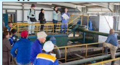
Инженерүүдэд зааварчилгаа өгч байгаа нь

Дорноговь аймгийн бохир усны шугам хоолойн байгууламж хангалтгүй байдаг. Түүнчлэн 2015 онд бохир ус цэвэрлэх байгууламж шинээр байгуулагдсан боловч түүний ашиглалт үйлчилгээг явуулах менежментийн ур чадвар дутагдаж байсан. 3 жилийн хугацаатай энэхүү төслийн хүрээнд бохир ус ариутгах татуургын менежментийн чадавхийг сайжруулах болон тухайн орон нутгийн усны орчинг сайжруулах зорилгоор инженер техникийн заавар өгөх, Японд сургалтанд хамруулах, усны орчны боловсролын сургалт зохион байгуулах зэрэг арга хэмжээг авч хэрэгжүүлсэн бөгөөд 2018 оны 3 сард үйл ажиллагаа өндөрлөв. Төслийн баг сүүлийн удаа тус аймагт ажиллах үеэр Дорноговь аймгийн засаг дарга төслийг гүйцэтгэсэн Шизуока мужийн төлөөлөлд гүн талархал илэрхийлэв.