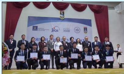
Батламж гардан авсан оюутнууд

3 сарын 14-ний өдөр “Инженер, технологийн дээд боловсрол” төслийн хүрээнд Японд суралцах багш, оюутнуудад батламж гардуулах ёслол болов. Япон хэлээр байгалийн ухаан ба математикийн хичээлийг эрчимтэй үзсэний үр дүнд Японы их дээд сургууль болон коосэнд элсэх шалгалтад тэнцсэн оюутнууд ийнхүү Японд улсын сургуулиудад механик инженер, барилга, архитектурын чиглэлээр суралцахаар мордох гэж байна.