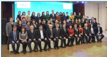
Бүх гишүүдийн хуралд оролцогсод зураг авахуулав

3 дугаар сарын 2-ны өдөр ЖАЙКА-ийн Сургалт төгсөгчдийн холбооны “Бүх гишүүдийн хурал” зохион байгуулагдаж, холбооны тэргүүн Ц.Оюунбаатар болон ЖАЙКА байгууллагын төлөөлөл, холбооны гишүүд зэрэг нийт 53 хүн оролцов. Тус хурлын үеэр 2017 оны үйл ажиллагааны тайлан болон 2018 оны үйл ажиллагааны төлөвлөгөөг танилцуулснаас гадна сургалтын үр дүнг ажилдаа нэвтрүүлэх чиглэлээр идэвхи зүтгэл гарган ажилласан 3 хүнийг (Боловсрол, хүнсний аюулгүй байдал, гамшгаас хамгаалах чиглэлээр ажилладаг) ”Шилдэг туршлага нэвтрүүлэгч”-ээр шалгаруулж шагнал гардуулав. Дээрх 3 хүний үйл ажиллагааны талаар дараагийн дугаараас танилцуулах болно.