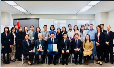
Сургалтын дараах үнэлгээний хурлын үеэр

2 сарын 25-наас 3 сарын 2-ны өдөр ТХА “Шударга өрсөлдөөний орчныг бэхжүүлэх нь” төслийн хүрээнд Японы шударга худалдааны хорооны дэмжлэгээр Японы монополийг хориглох хуулийн хэрэгжилтийн байдал, зах зээлийн судалгааны арга ба түүнийг хэрхэн ашиглах талаар Япон улсад сургалт зохион байгуулж, Шударга өрсөлдөөн, хэрэглэгчийн төлөө газрын байцаагч зэрэг нийт 15 хүн оролцов. Оролцогчид “Зах зээлийн судалгааны аргыг сайн ойлголоо. Монголын нөхцөлд хэрхэн ашиглаж болохыг нь судалж үзмээр байна.” хэмээн сэтгэгдэлээ илэрхийлж байсан зэргээс үзэхэд энэхүү сургалт нь ихээхэн сэдэл өгсөн арга хэмжээ болсон байна.