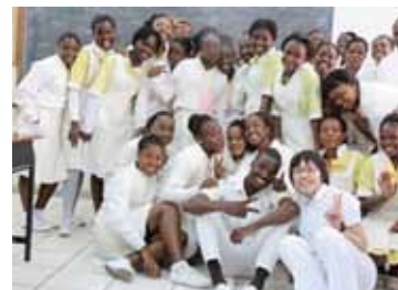
Voluntaria da JICA uma professora de enfermagem no Instituto de Ciências de Saúde

A JICA envia voluntários japoneses para cooperação internacional (JOCV) e voluntários seniores (SV) nas áreas de educação, saúde, agricultura, etc. Através dessas actividades, os voluntários participantes não apenas podem contribuir no desenvolvimento dos países parceiros, mas também ganhar uma valiosa experiência em termos de boa vontade internacional, entendimento mútuo e expansão de suas perspectivas internacionais.