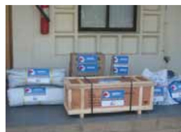
Equipamento de ajuda de emergência

Em caso de ocorrência de desastre de grande magnitude, a JICA envia Equipes Japonesas de Socorro a Desastres em resposta aos pedidos dos governos afectados. Também, a JICA providencia bens e equipamentos de ajuda de emergência, tais como mantas, tendas e medicamentos.