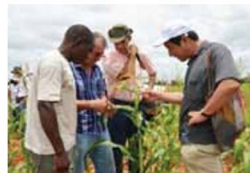
Especialistas Agrícola do Japão, Brasil e Moçambique

Para o desenvolvimento de recursos humanos e formulação de sistemas administrativos dos países em desenvolvimento, a cooperação técnica envolve o envio de peritos, o fornecimento de equipamento necessário e a formação do pessoal moçambicano, no Japão assim como nos outros países como o Brasil. Os projectos são formulados no sentido de responderem a um vasto conjunto de questões.