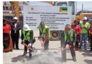
Reabilitação e Expansão do Porto de Nacala

Os Empréstimos ODA apoiam o desenvolvimento dos países providenciando baixos juros, são empréstimos concessionais e de longo prazo (em moeda japonesa Yen) para financiar os projectos de desenvolvimento de tais países. Os empréstimos ODA são principalmente usados para financiar projectos de infra-estruturas de grande escala.