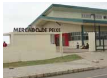
O novo Mercado de peixe

Donativo é a provisão de fundos sem obrigatoriedade de reembolso por parte do beneficiário. A concessão de donativo é usada para o melhoramento de infra-estruturas básicas, tais como: escolas, hospitais, infra-estruturas de abastecimento de água e estradas incluindo o fornecimento de respectivo equipamento.