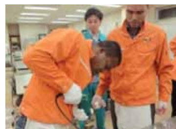
Treinamento de pessoal da EDM no Japão

Os programas de treinamento no Japão proporcionam oportunidades aos participantes de terem uma visão geral sobre as tecnologias mais recentes, bem como de aprender as política e sistemas que o Japão desenvolveu ao longo da sua história. A JICA oferece, anualmente, a Moçambique mais de 60 oportunidades de treinamento nas áreas agricultura, saúde, meio ambiente, combate a corrupção e desenvolvimento rural.