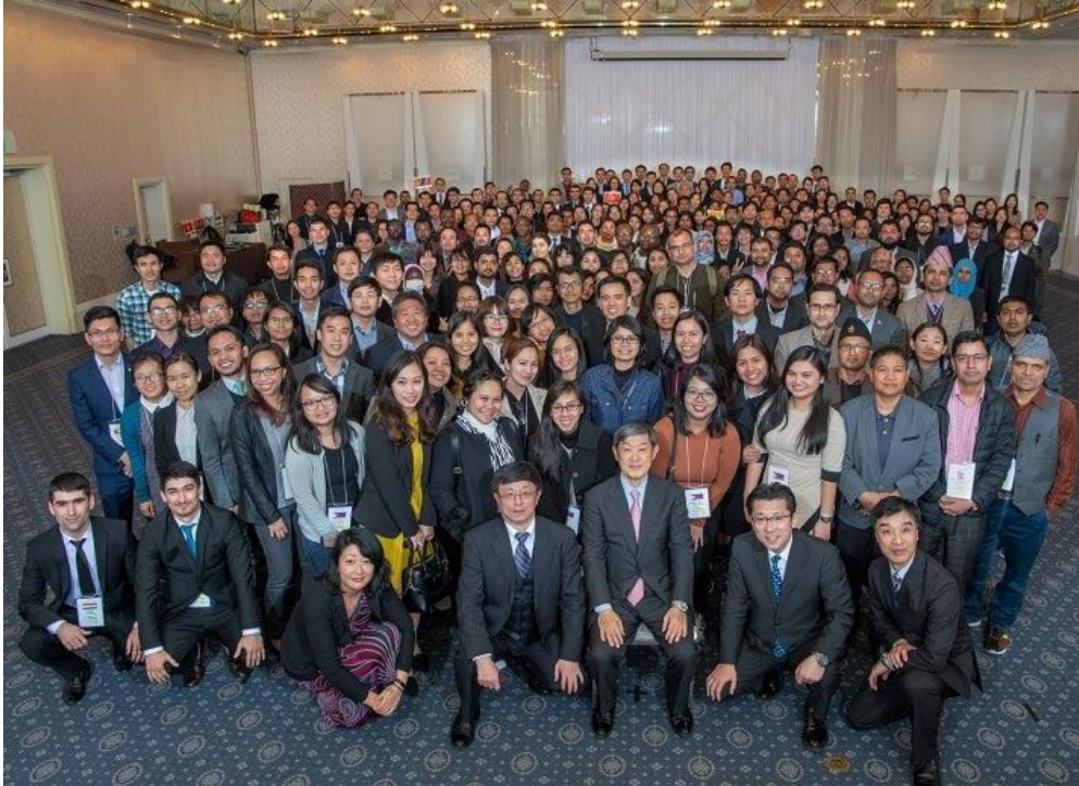
၂၀၁၉ခုနှစ် မတ်လတွင် JDSပညာသင်ဆုအစီအစဉ်တွင် ပါဝင်ခဲ့ကြသော နိုင်ငံတကာကျောင်းသားများအားတွေ့ရစဉ်

ဆက်လက်လုပ်ဆောင်ကာမြန်မာနိုင်ငံနှင့်ဂျပန်နိုင်ငံရေရှည်တည်တံ့သည့်ဆက်ဆံရေးတိုး တက်မှု အတွက် ကြိုးပမ်းလျက်ရှိပါတယ်။