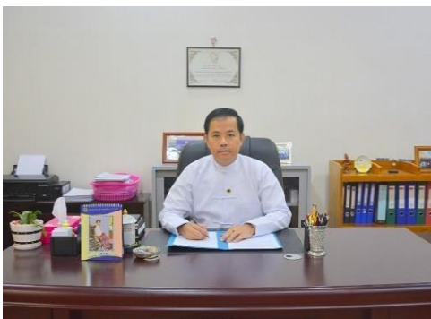
ဂျပန်နိုင်ငံတွင် ပညာသင်ကြားခဲ့စဉ် (ဘယ်) ။ နိုင်ငံခြားရေးဝန်ကြီးဌာန၏အမြဲတမ်းအတွင်းဝန်အဖြစ် တာဝန်ထမ်းဆောင်စဉ် (ညာ)