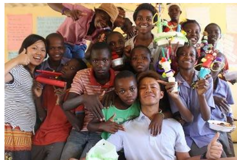
ミスターコンピューターは小さいけど万能なのだ