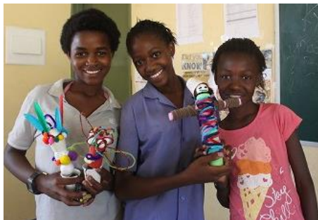
女の子たちはカラフルなお花と私の人形をつりました！

るぐるとカラフルなお花が回る仕組みです。何はともあれ、みんなとっても楽しんで作業していたその顔を見ることができて、私も KYOSUKE 先生も大満足。最後に、みんなの前で各グループ作ったものの発表をしました。「この車はニューヨークという名前で、一生走り続けるんだ！」と自慢げに自分たちが作った作品を紹介する姿にほっこりでした。子どもたちに素晴らしい経験をさせてくれた KYOSUKE 先生に感謝です。みんなの未来が、楽しみです。