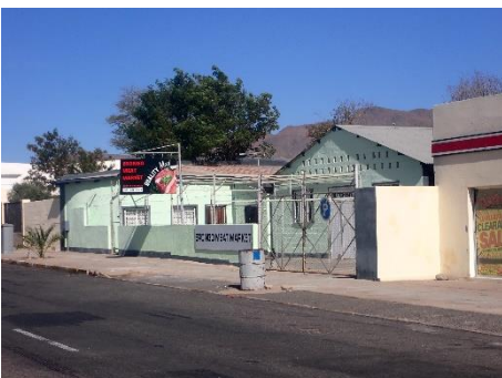
↑エロンゴミートマーケット (肉屋)