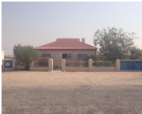
↑DACO メディカルサービス(診療所)