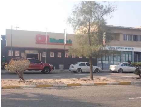
↑OK (スーパー) と薬局