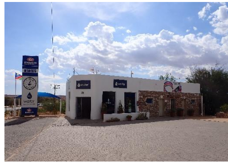
↑R03 Water (水の販売所)