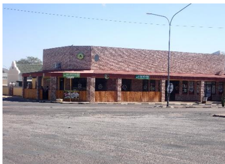
↑Big Brother (レストラン)