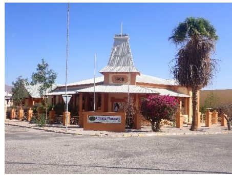
↑Usakos Museum (ウサコス博物館)