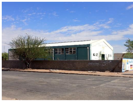
↑ウサコス セカンダリースクール (高校)