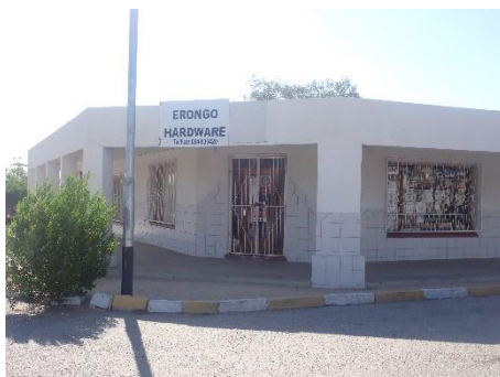
↑エロンゴハードウェア (金物屋)