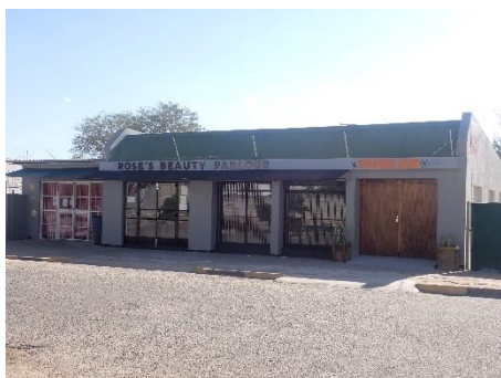
↑Paper Jam (印刷屋) & ビューティーショップ