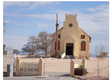
↑教会 (日曜日の 10 時に人が 集まります。)