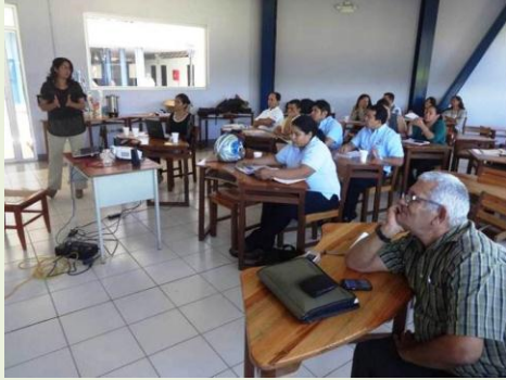
Participantes del taller 5S en una de las exposiciones.

Como parte de las actividades del Proyecto de Cooperación de Seguimiento Tecnologías de Gestión de la Producción (TGP) para PYME's, se realizaron capacitaciones sobre la metodología de trabajo japonesa 5S. Estas charlas fueron impartidas por personal de la Universidad Nacional de Ingeniería (UNI) en las ciudades de Managua, Estelí, León y Chinandega, donde participaron 119 personas entre dueños de PYME's, consultores independientes y expositores. En las charlas, se realizaron varias actividades como conferencias y exposiciones sobre la herramienta