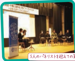
5人のパネリストを迎える第2部

により現地の女性の地位や収入が向上していることをご紹介いただき、小さな協力が大きな協力につながる可能性について熱く語っていただきました。