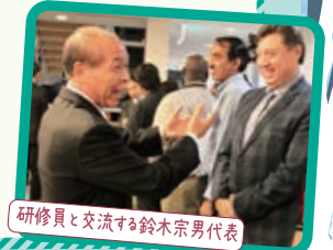
研修員と交流する鈴木宗男代表