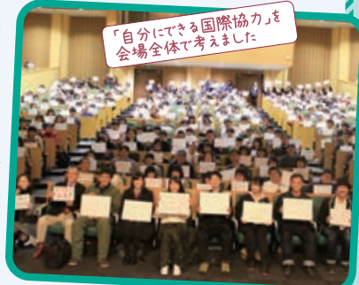
「自分にできる国際協力」を 会場全体で考えました

(今回のイベントを通じ、多くの方が世界とつながるため、国際協力のための第一歩を踏み出してくださることを期待しています。開発途上国だけでなく、道東・十勝における地域活性化に貢献すべく取り組んで参りますので、今後ともより一層のご理解とご支援をお願いいたします。)