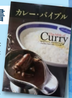
「カレー・バイブル」 発行所 株式会社ナツメ社

日本の国民食として親しまれてきたカレー。独自の製法で作り上げられた各国のカレーはその国の文化を表し、時に私たちへ日本に居ながら異国の雰囲気を届けてくれます。アジア各国のカレーレシピから日本のカレーのアレンジ、そしてサイドメニューまでボリューム満点のレシピ本。いつもと違うカレーにチャレンジしませんか?