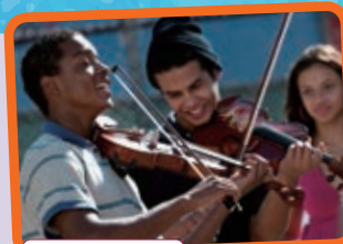
ストリートオーケストラ

■日時:2017年2月11日(土)、12日(日) 10:00~15:00 ■場所:森の交流館・十勝 及び JICA北海道国際センター(帯広)