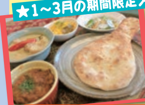
●おびくっくセット〜アジア編...780円

インド風マトンカレー、タイ風イエローカレー、レモンライス、そしてナンがついたお得セット。おすすめ図書「カレー・バイブル」で紹介されているメニューです。