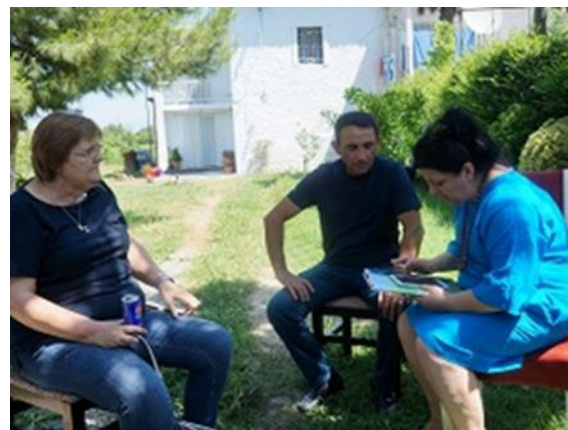
写真2 ニーズ調査の様子

当プロジェクトではこのような農家のニーズに応えるために、ABAセンターの設立・運営、サ