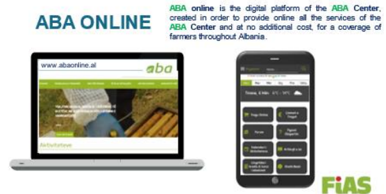
写真 4 ABA online はインタラクティブなデジタル・プラットフォーム

ABA センターでは各種の農業分野（ハウス野菜、露地野菜、畜産、果樹等）の技術専門家 6 名が「コアエキスパート」として農業技術面での情報提供や研修の担当をしています。ABA オンラインに登録した会員は、「Ask Expert」の機能を使って、プラットフォームの背後にいるこれらの専門