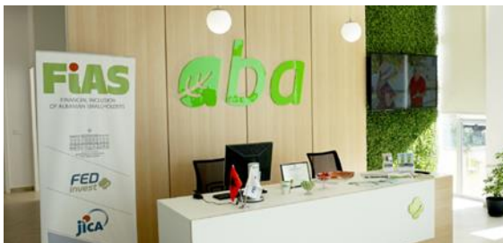
写真 3 ABA センターの所在地である Lushnja は野菜栽培が盛ん

「ABA センター」の ABA とは、Agro Business Assistance の頭文字、小規模農家の農業ビジネスの発展のための手助けをするセンターである、といった意味があります。物理的なスペースとしてのセンターは、アルバニア農業の中心地である Lushnja に設置されました。このセンターでは農家向けの農業技術研修や、各種のバリューチェーン・アクターとのネットワーキングイベントが開催されることが想定されています。センターは 2020 年 1 月末に「ソフト・オープニング」されましたが、残念ながら 2020 年は COVID 19 の影響でその後対面での活動がほとんどできない状況となってしまいました。