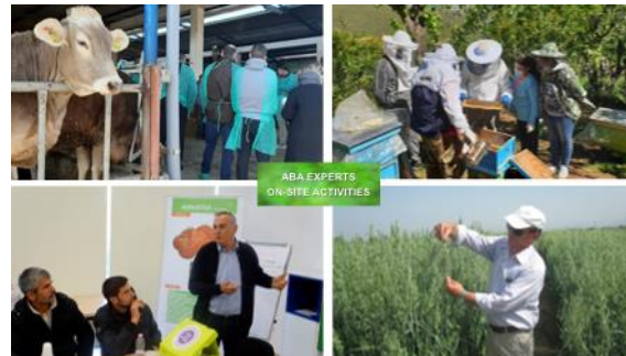
写真 5 コアエキスパートによる研修活動 家に直接ピンポイントな質問をすることができます。

ABA センターでは各種の農業分野（ハウス野菜、露地野菜、畜産、果樹等）の技術専門家 6 名が「コアエキスパート」として農業技術面での情報提供や研修の担当をしています。ABA オンラインに登録した会員は、「Ask Expert」の機能を使って、プラットフォームの背後にいるこれらの専門