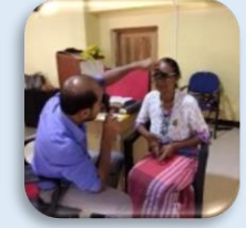
අක්ෂි රෝග පරීක්ෂාව