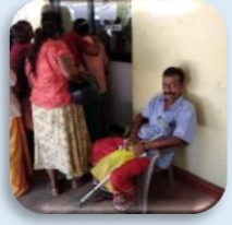
උපදේශන සඳහා රැඳී සිටින වැඩිහිටි රෝගීන්

සායන වෙත යොමු කිරීම: රෝග විනිශ්චය කිරීමෙන් පසු රෝගීන් පොළොන්නරුව මහ රෝහලේ අදාළ සායන වෙත යොමු කරන ලදී. සෞඛ්‍ය සම්පන්න සහ ක්‍රියාශීලී ජීවන රටාවක් සහතික කිරීමට පෝෂණය, ව්‍යායාම, මානසික සෞඛ්‍යය සහ රෝග වැළැක්වීමේ පියවර වැනි විවිධ සෞඛ්‍ය මාතෘකා පිළිබඳව වැඩිහිටි පුද්ගලයින් දැනුවත් කිරීම සඳහා සෞඛ්‍ය අධ්‍යාපන සැසි කීර්තිමත් සෞඛ්‍ය සේවා වෘත්තිකයන් විසින් පවත්වන ලදී.