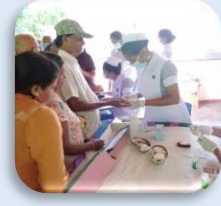
බෝ නොවන රෝග සඳහා පරීක්ෂා කිරීම