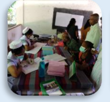
සායන පොත භාවිතයෙන් රෝගීන් සායන වෙත යොමු කිරීම