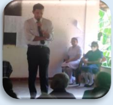
සෞඛ්‍ය අධ්‍යාපන සැසි