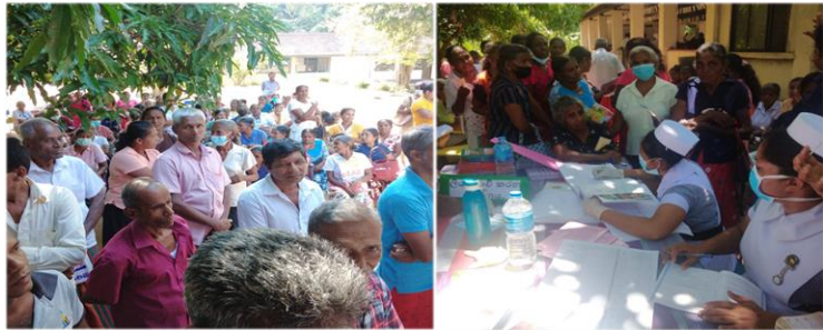
පොළොන්නරුව ජංගම සෞඛ්‍ය සායනයට සහභාගී වූවන් සහ කාර්ය මණ්ඩලය