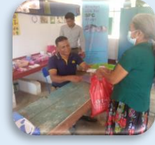
සියලුම රෝගීන් සඳහා නොමිලේ ඖෂධ නිර්දේශ කිරීම