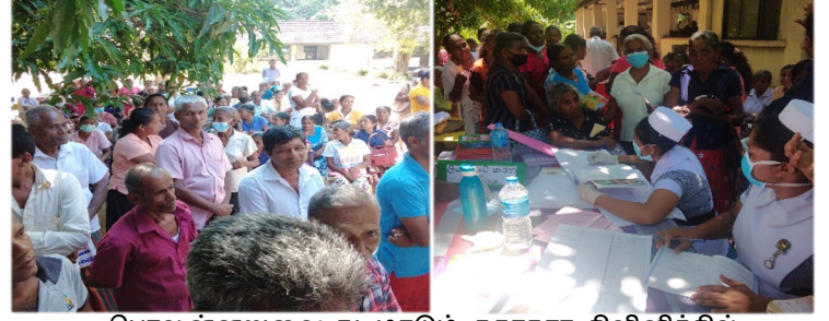
பொலன்னறுவை நடமாடும் சுகாதார கிளினிக்கில் பங்கேற்பாளர்கள் மற்றும் ஊழியர்கள்