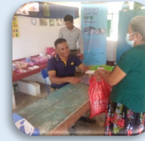
அனைத்து நோயாளிகளுக்கும் இலவச மருந்து வழங்குதல்