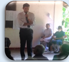
சுகாதார கல்வி அமர்வுகள்