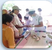
தொற்றா நோய்களுக்கான (NCD) பரிசோதனை