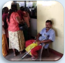
வைத்திய ஆலோசனைக்காக காத்திருக்கும் நோயாளிகள்

பரிந்துரை: நோயறிதலின் பின்னர், நோயாளிகள் பொலன்னறுவை பொது வைத்தியசாலையில் உள்ள குறித்த கிளினிக்குகளுக்கு பரிந்துரைக்கப்பட்டனர். ஆரோக்கியமான மற்றும் சுறுசுறுப்பான வாழ்க்கை முறையை உறுதி செய்வதற்கான ஊட்டச்சத்து, உடற்பயிற்சி, மனநலம் மற்றும் நோய் தடுப்பு நடவடிக்கைகள் போன்ற பல்வேறு சுகாதார பிரிவுகளைப் பற்றி முதியோர்களை தெளிவூட்டும் வகையில் பிரபல்யமான சுகாதார நிபுணர்களால் சுகாதாரக் கல்வி அமர்வுகள் நடத்தப்பட்டன.