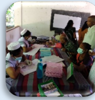
கிளினிக் புத்தகத்தைப் பயன்படுத்தி நோயாளிகளை வைத்தியசாலைகளுக்கு பரிந்துரைத்தல்