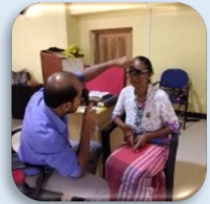
கண் நோய்க்கான பரிசோதனை