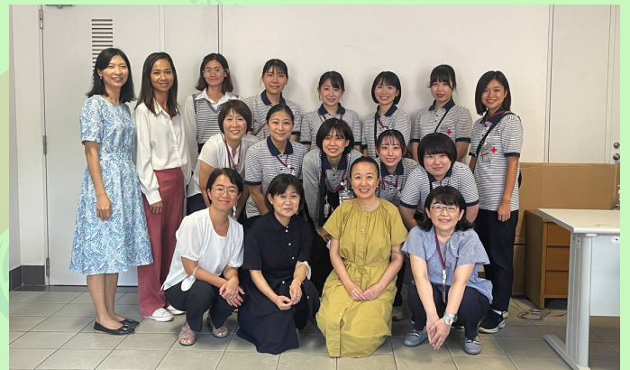
Japanese Red Cross Tour Students & Lecturers with Members of Strings Project