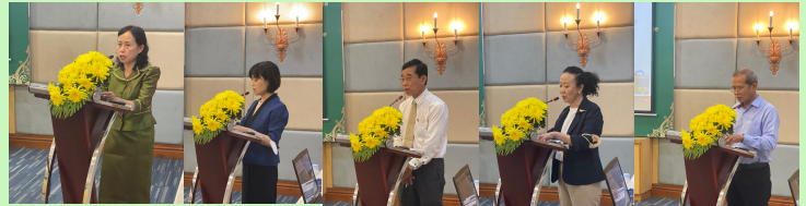
Presentations and other activities during the meeting

បន្ទាប់ពីវគ្គសិក្សាលើកទី ២ ជាមួយអង្គការការងារបច្ចេកទេសនៅថ្ងៃទី ១១ ខែសីហា យើងបានធ្វើការប្រជុំជាមួយអង្គការការងារបច្ចេកទេសចំនួន ១៧ ដូចដែលបានរៀបរាប់នៅក្នុងប្រតិទិនសកម្មភាពគម្រោងខាងលើ និងក្នុងខែមុន។ តាមរយៈការពិភាក្សាយ៉ាងសកម្មរបស់សមាជិកក្រុមនីមួយៗនៅក្នុងពេលប្រជុំដោយផ្ទាល់ក្តី ឬតាមប្រព័ន្ធអនឡាញក្តី គ្រប់គ្នាខិតខំបន្តធ្វើការលើគ្រោងនៃកម្មវិធីសិក្សា និងអភិវឌ្ឍន៍មាតិកាប្រកបផ្សេងៗ។