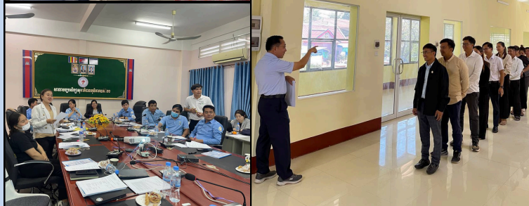
Activities during the Training of Trainers in BTB & KC

The project conducted another round of ToT 3 sessions in BTB and KC. These sessions took place at the Regional Training Centers with the support of the RTC's and PHD's directors, as well as the Ministry of Health.