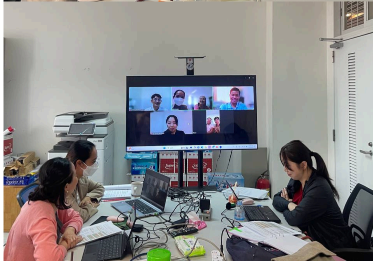
Online Meetings with Basic Nursing Skills teams (BTB & KC)