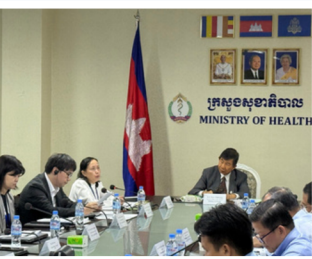
Active Discussion During the Meeting