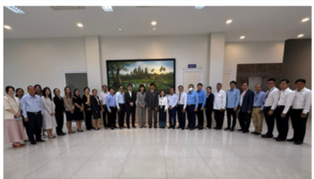
Participants of the JCC meeting