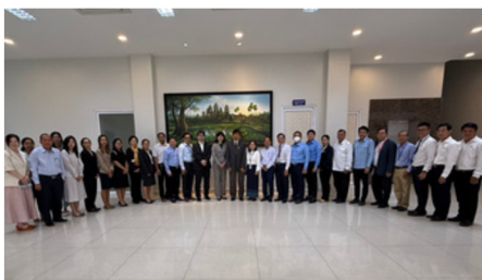
Participants of the JCC meeting