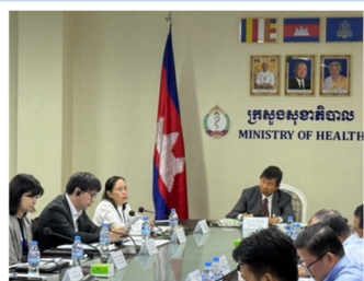
Active Discussion During the Meeting

A potential plan to expand the ToT program to other provinces was also shared, and participants exchanged views on future possibilities, remaining challenges, and areas for further coordination. While recognizing that additional efforts will be required to move forward, the meeting concluded with a strong sense of shared commitment to strengthening the INSET system for nurses and continuing close collaboration among all stakeholders toward achieving the Project's objectives.