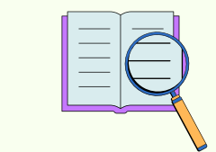
Training Observation in KC