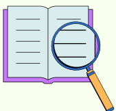
Training Observation in KC