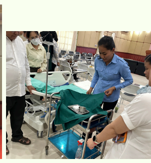
Nursing Ethics Module