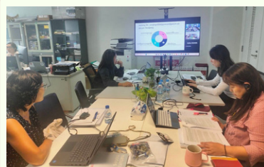
Final INSET course in SPL OD in BTB

As we move into the next phase, our focus shifts toward ensuring the sustainability of these achievements. In the remaining project period, we will conduct comprehensive INSET review meetings, follow-up seminars for trainers, and updates to training materials along with the development of trainers nationwide by ToT4. Our final goal is to empower the Ministry and PHDs to manage INSET independently, ensuring sustainable quality in Cambodia's nursing care.