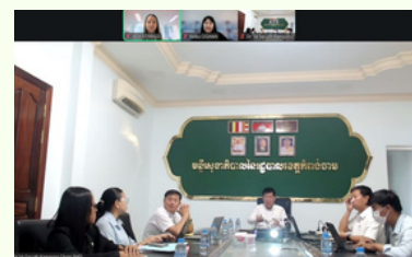
Meeting with KC Team