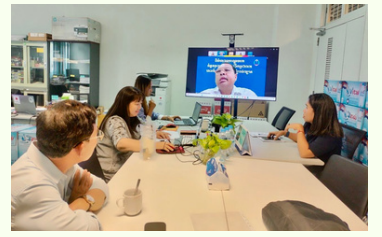
Final INSET course in SPL OD in BTB