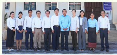
Meeting with Kampot & Stung Treng