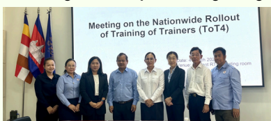
Meeting on the Nationwide Rollout of Training of Trainers (ToT4)