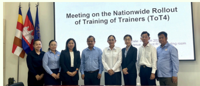
Meeting on the Nationwide Rollout of Training of Trainers (ToT4)