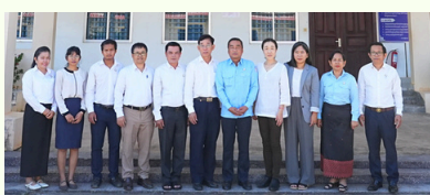
Meeting with Kampot & Stung Treng

On March 23 rd , the project conducted practical training for officers of HRDD, KC and BTB PHDs. As future administrators of our new Moodle-based platform, participants acquired foundational skills for e-learning course creation. By building technical proficiency now, the team will be ready to utilize the platform immediately after the upcoming content migration. This proactive groundwork ensures that by the scheduled launch in August, our partners can independently manage and develop their own e-learning courses.