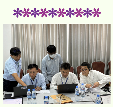
Moodle Hands-on Training