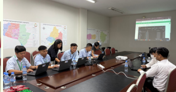
Moodle Hands-on Training