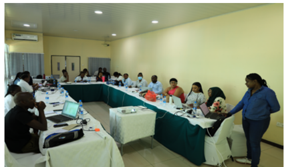
質改善 (QI) 研修で改善活動を発表するチレンジェ病院からの参加者