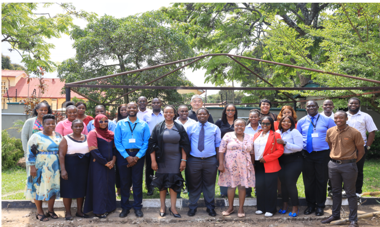
ルサカ郡保健局が開催した5つの一次レベル病院向け質改善研修での集合写真

研修の終わりに、各施設は演習で作成した質改善プロジェクトの計画を完成させ、提出することを求められました。ファシリテーターと研修参加者は、提出された質改善計画を相互にレビューし、助言する予定です。本研修は終始、このような双方向のやりとりが重視されました。