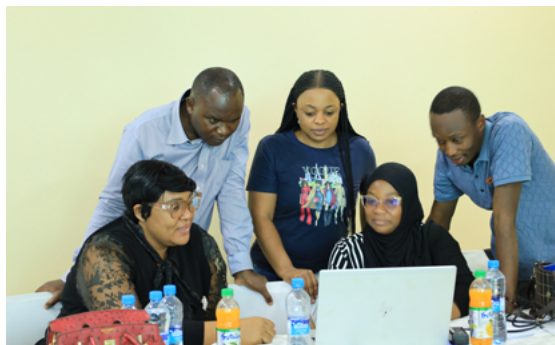
質改善 (QI) 研修でグループワークに取り組むカニヤマ病院の参加者