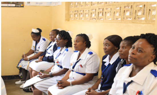
チェルストン・ミニでのバランス・スコアカード (BSC) 更新会議に参加する各部門長