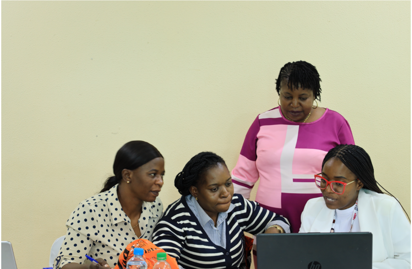
ルサカ郡保健局によって開催された郡内5病院を対象とした5日間の質改善研修。グループワークの様子(2026年2月23日から27日)