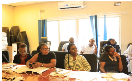
感染予防管理 (IPC) 標準化会議の参加者