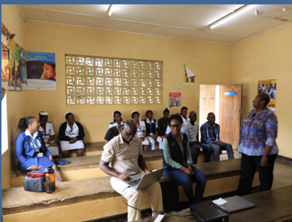
バランス・スコアカード (BSC) レビュー会議で各部門長を迎えるシバンダ院長 (チェルストン・ミニ病院)