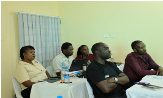
質改善 (QI) 研修で発表を聞くファシリテーター