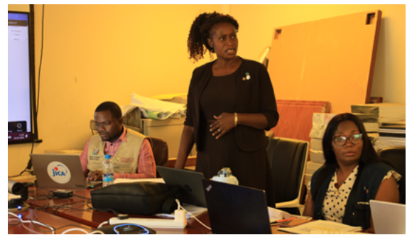
標準化会議で発表するチブーラ主任環境保健技術者