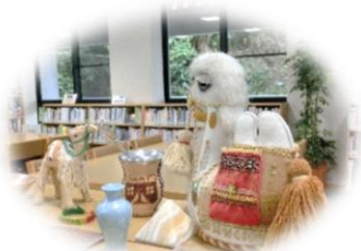
研修員から寄贈された民芸品 Folkcraft articles donated by JICA participants