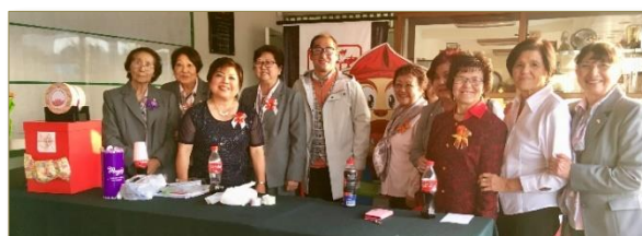
ペルー・沖縄婦人会のみなさん

ウチナアンチュ・コミュニティの強みは、チームワークです。強いコミュニティを形成するには、文化、歴史、そして先人たちが教えてくれた我々一人一人の心に息づく価値観とともに、団結しなくてはなりません。喜ばしいウチナアンチュの日を！