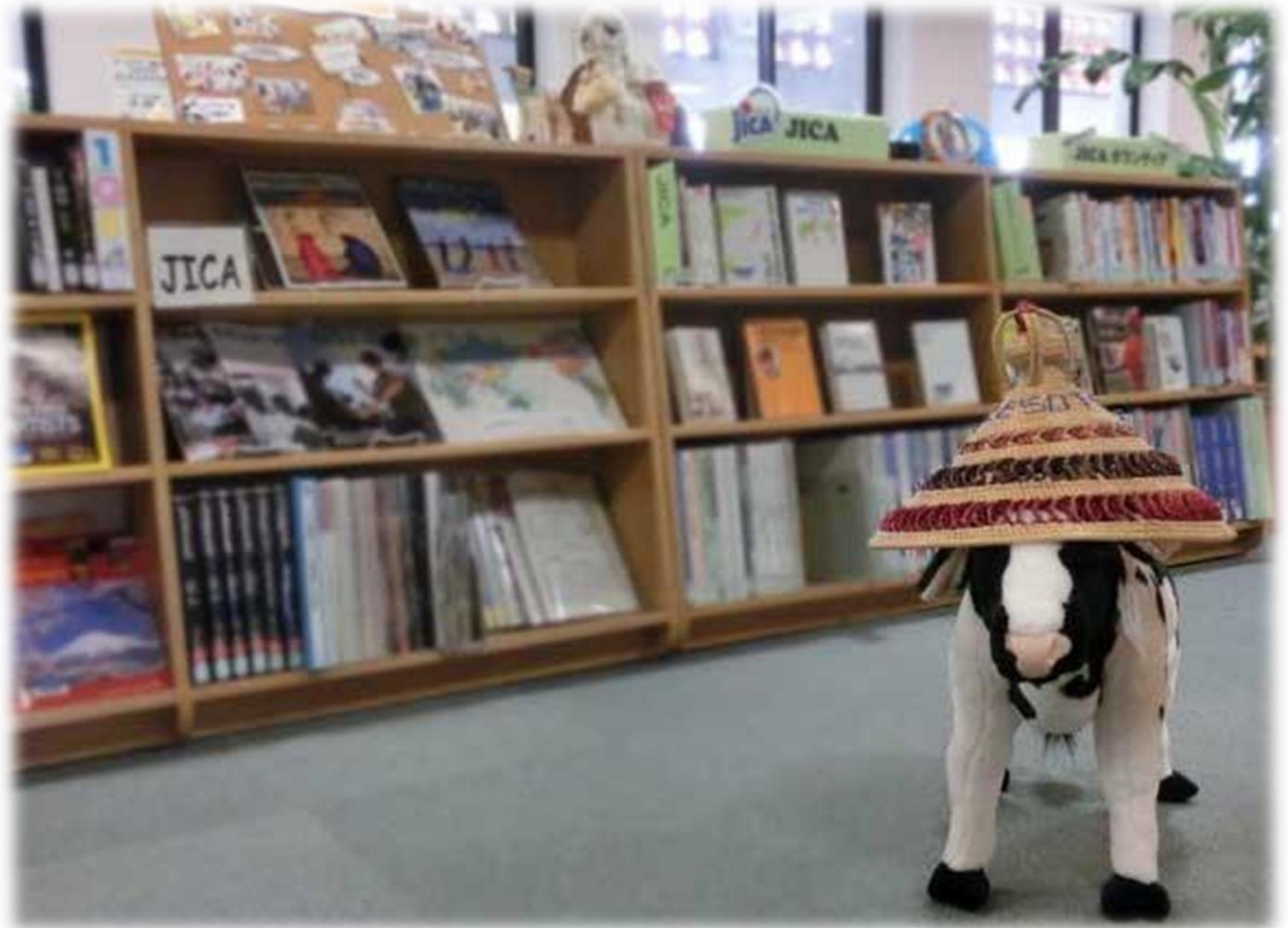
Traditional hat from Lesotho

(JICA 沖縄ホームページ → 図書資料室 → JICA 沖縄国際センター図書資料室 蔵書検索)