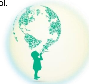
6~15 歳の学校に通わない子どもたち

「世界の学校」と題した企画コーナーでは、子どもたちが学校に通っていないその理由について 知ることができます。