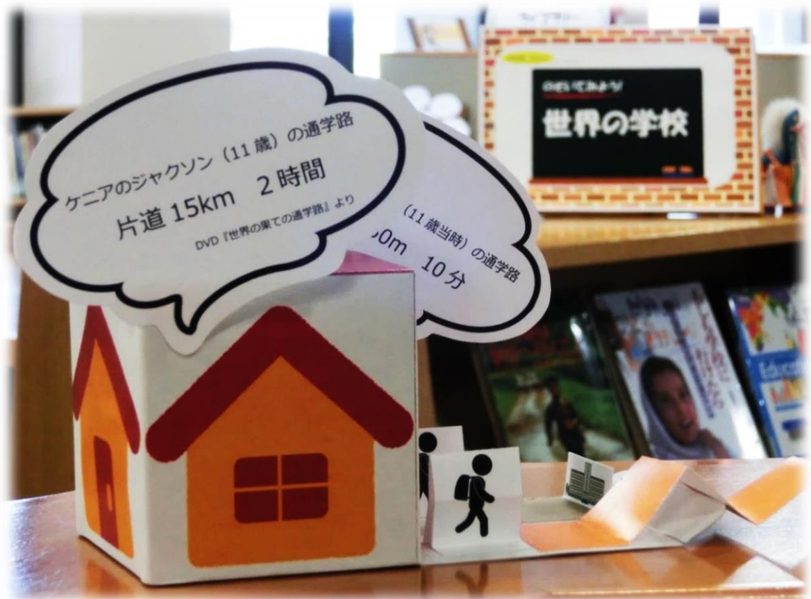
Out-of-school children 学校に通わない子どもたち

(JICA 沖縄ホームページ → 図書資料室 → JICA 沖縄国際センター図書資料室 蔵書検索)