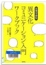
『異文化コミュニケーション入門 ワークブック』中村 良廣/著 松柏社 (2014.9)