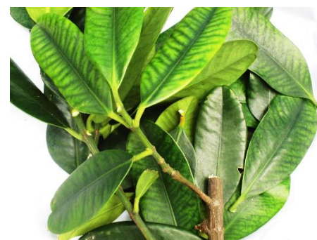
フク木(オトギリソウ科) Hukugi (family Clusiaceae)

Hukugi (Common garcinia; a type of tree) is widely used around houses and farmlands as a windbreak, and also as a roadside tree, it is frequently seen in Okinawa. While it is planted for those purposes, Hukugi is one of the typical dyes extracted from plants sources. Its tender tone is a particular color of Okinawan Plant Dyeing.