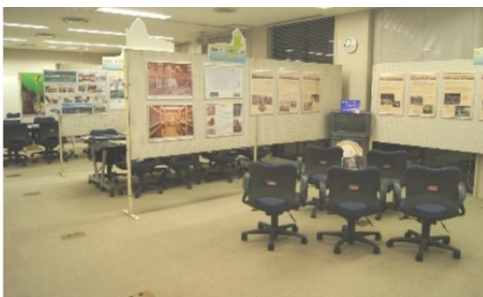
ひとつの部屋を2～3ブースに分割