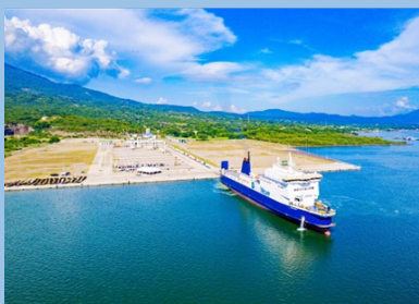
エルサルバドルとコスタリカ間のフェリー事業の開始