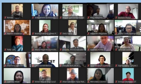
エルサルバドル算数プロジェクトの成果と課題共有セミナー参加者