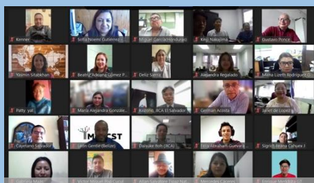
Participantes virtuales del Seminario “Avances y Desafíos en la Matemática Educativa en El Salvador”