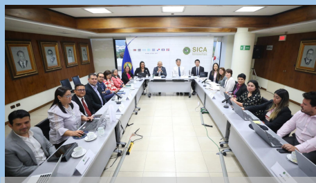
Participantes presenciales de la IV Reunión de Consultas SICA-JICA para la Cooperación Regional