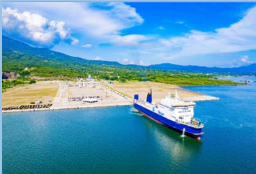
El lanzamiento del proyecto del ferri entre El Salvador y Costa Rica