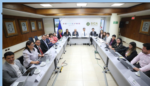
SICA-JICA 地域協力コンサルテーション会議の対面参加者

SICA-JICA コンサルテーション会議の議事録作成・署名への支援。 算数教育オンラインセミナーの報告書作成・広報支援。 10 月開催予定の地方行政ワークショップ実施への側面的支援。