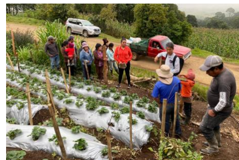
ホンジュラス共和国インティブカ県における調査風景(1990年代後半に日本の協力を背景として結成された農家グループへの聞き取り)