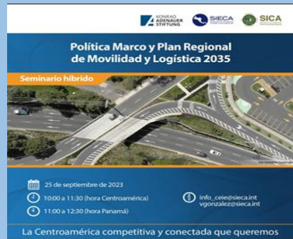
Seminario Virtual: La Política Marco y Plan Maestro Regional de Movilidad y Logística 2035