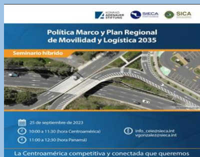
MP2035 の普及に係る Webinar