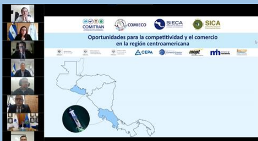
エルサルバドルとコスタリカ間のフェリー事業に係る Webinar