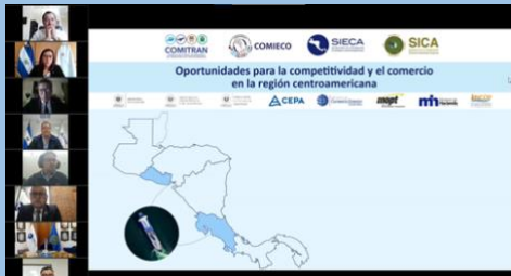
Webinar El Ferri entre El Salvador y Costa Rica: Oportunidades para la competitividad y el comercio en la región Centroamérica