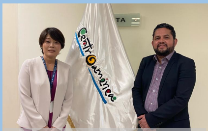
中米観光プロモーション機構 (CATA) の新事務局長と櫻井専門家