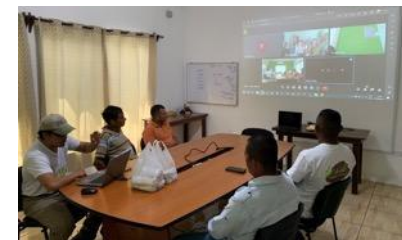
セルバマヤ越境村落間の会合