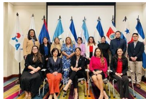
第五回地域ワークショップ