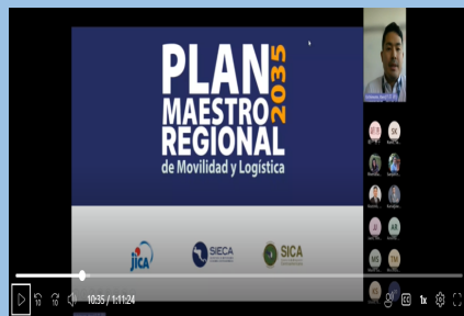
Segunda Reunión Virtual para compartir el avance de cooperación regional SICA-JICA con las oficinas de JICA en la región SICA