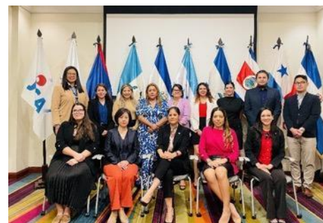
El 5to taller regional