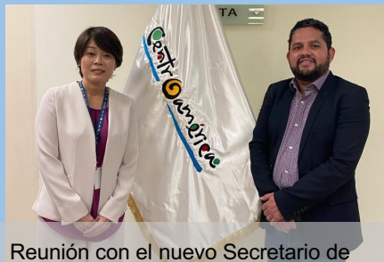
Reunión con el nuevo Secretario de la Agencia de Promoción Turística de Centroamérica (CATA)