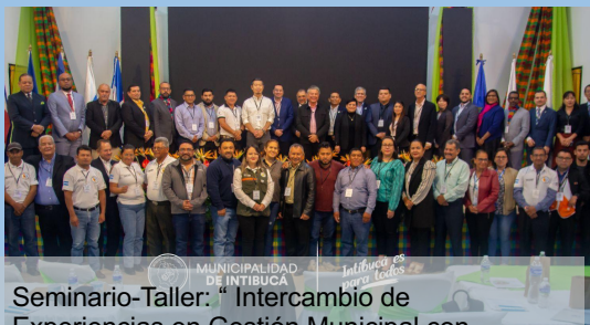
Seminario-Taller: “ Intercambio de Experiencias en Gestión Municipal con Participación Ciudadana en la Región del SICA”, Intibucá, Honduras