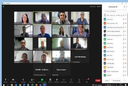
課題別研修の渡航前オリエンテーション