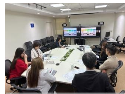
Reunión entre STM-COMMCA y JICA para discutir sobre la aprobación por COMMCA y su operativización de la metodología