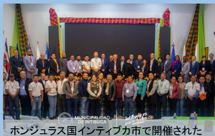
ホンジュラス国インティボカ市で開催された「SICA 地域における市民参加による地方行政知見共有会」の参加者