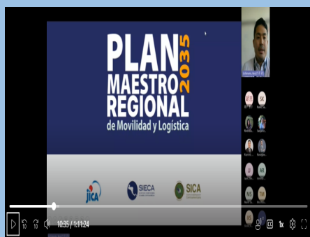
第2回 SICA ハーモナイゼーション会合での発表