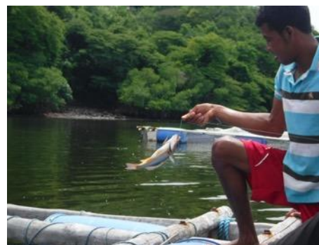
Pargos cultivados en el proyecto piloto del Golfo de Fonseca (Nicaragua).