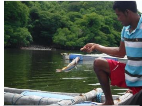
フォンセカ湾パイロットプロジェクトで養殖中のフェダイ(ニカラグア)