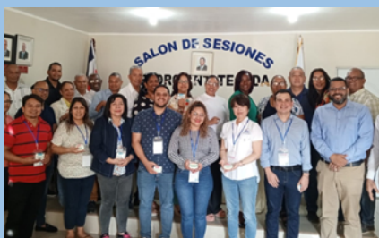
ドミニカ共和国地方行政プロジェクトに参加した市開発審議会との意見交換