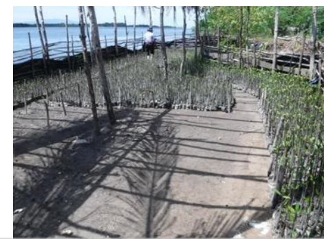
Plántulas de manglar para la reforestación del Golfo de Fonseca (Honduras).