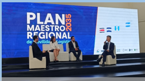
Panel de discusión en el evento de lanzamiento del P/M 2035