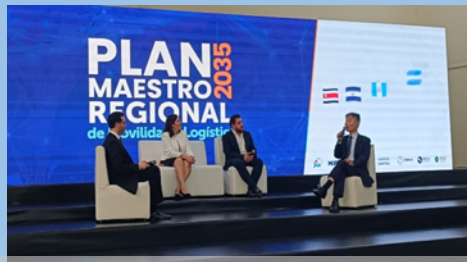
MP2035 ローンチイベントでのパネルディスカッション