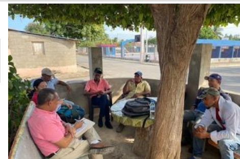
Reunión con asociaciones agrícolas y ganaderas sobre la gestión local de los recursos hídricos (República Dominicana).