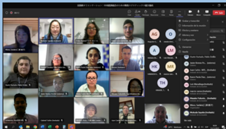
課題別研修の出国前オリエンテーション