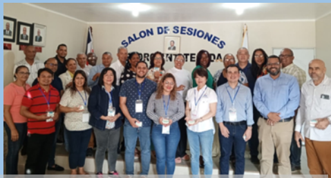
Visita a un Consejo de Desarrollo Municipal para conocer los resultados del Proyecto PRODECARE en República Dominicana