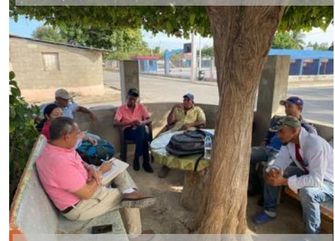
農業畜産組合と地域の水資源管理について協議(ドミニカ共和国)