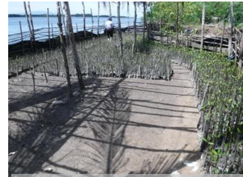
フォンセカ湾パイロットプロジェクト植林用のマングローブ苗(ホンジュラス)