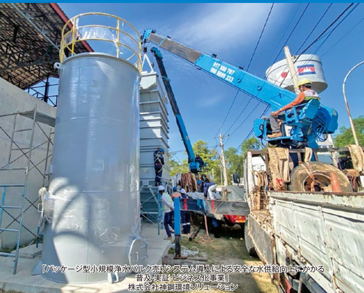
「パッケージ型小規模浄水バレル売りシステム導入による安全な水供給向上にかかる普及実証（ビジネス化事業）」 株式会社補鋼環境ソリューション