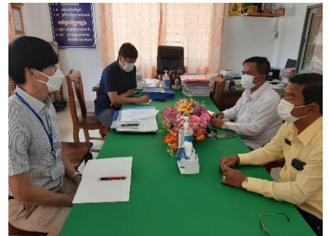
赴任先の校長先生との打合せ。拙いクメール語での自己紹介は伝わったのだろうか... ☺