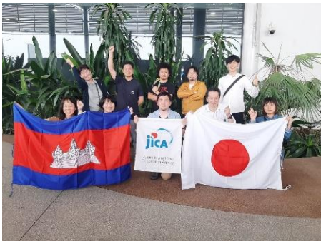
カンボジア到着時の記念撮影。 氷点下札幌から、真夏の地へ♡