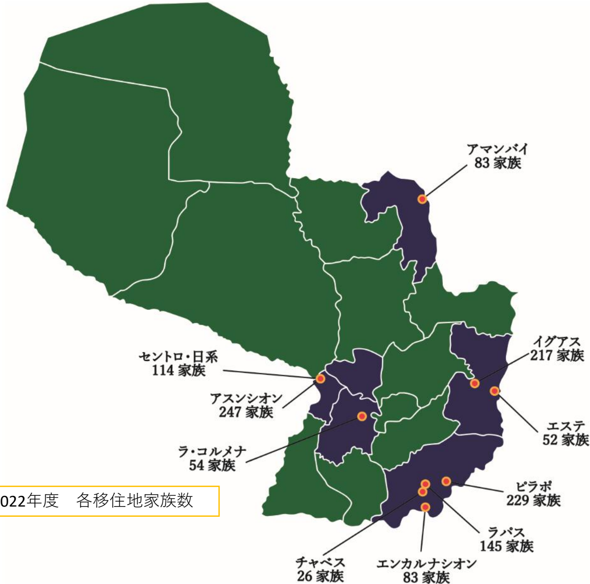
2022年度 各移住地家族数