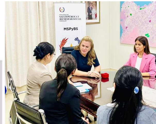
写真) (株)九州メディカル