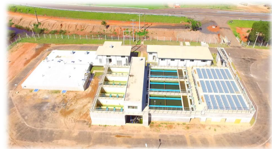
コロネル・オビエド市浄水場整備