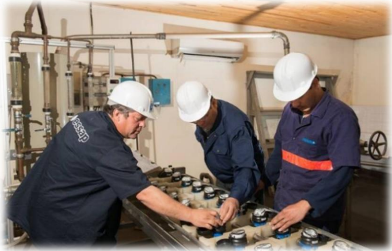
水分野：無収水対策等の技術支援