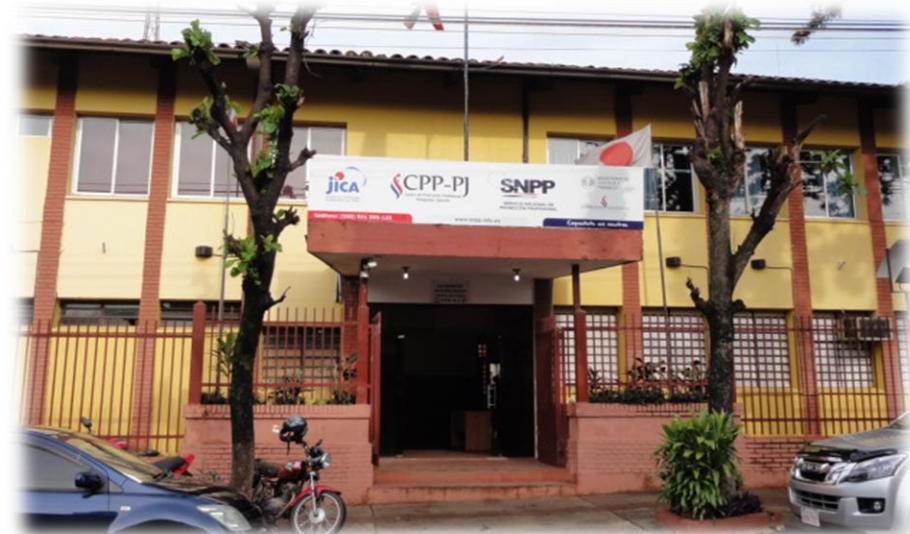
職業訓練技術センター建設・機材整備