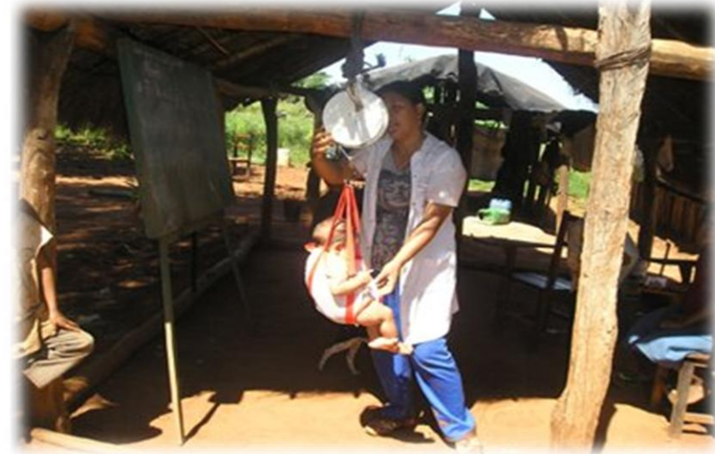
保健分野：看護師教育の強化、栄養改善等