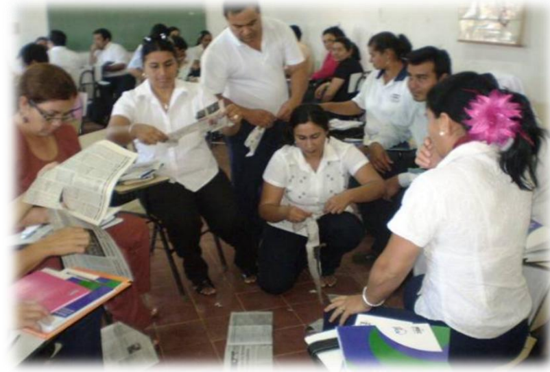
教育分野：学校運営管理能力向上等