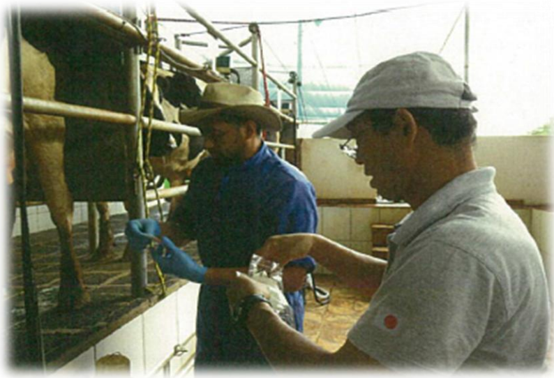
農業分野：農業研究所（CETAPAR）等への技術支援