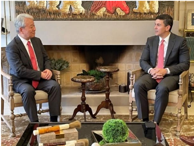
JICA理事長とペニャ大統領（2023年6月）