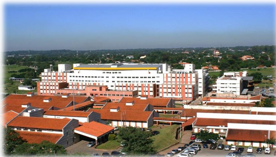
アスンシオン大学病院建設・整備