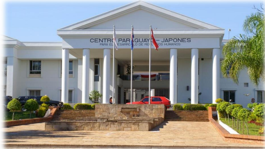
パラグアイ・日本人造りセンター建設