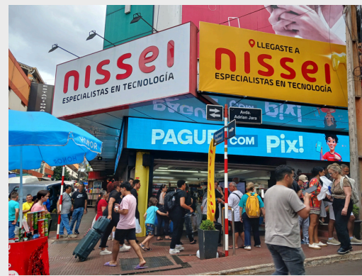
日系のNisseiは大人気店