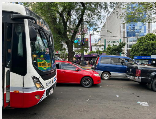
ブラジル行きのバス

(Puente de la Integración)の建設がはじまりました。パラグアイはブラジルと比して物価が安いことから、エステ市には多くのブラジルの人々が買い物に訪れます。市内には多くの企業が軒を連ね、中でも日系の方が創業したパラグアイ最大級の家電量販店「Nissei」は高い評価を受けています。エステ市の人々は、国内で手に入りづらい食品等をブラジルやその先のアルゼンチンに買いに行くなど、国境が近いことを活かした生活確立しています。