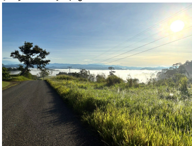
家の周り (雲海が見える)