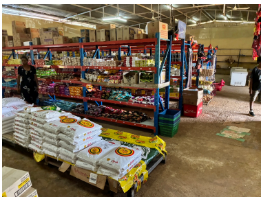
スーパーマーケット (中)