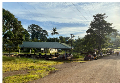
マーケット (バナナとイモが多い)

日本の都道府県は47あります。では、PNGはいくつの州があるでしょうか。(ちなみに国の面積は日本の1.25倍あります。)