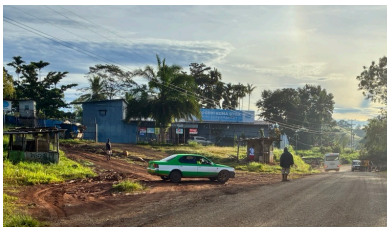
スーパーマーケット (外)

人は落ち着いていて、とても平和です。私は学校まで40分ほど歩いて行っていますが、たくさんの方があいさつをしてくれます。ここで主に話されている言語は、英語・ピジン語・モツ語の3つです。人によってあいさつの言語が違うので、私はいつもどの言語であいさつするか迷います。私の家の周りには、住んでいる人がほとんどいないので、家に帰ったら大体一人です。動画を見たり、勉強したりして過ごすことが多いです。