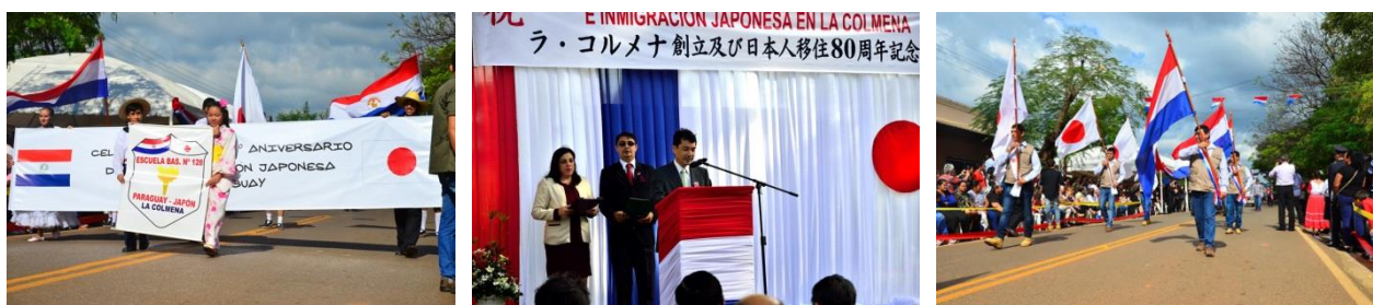
ラ・コルメナ創立及び日本人移住 80 周年記念式典及びパレード

ラ・コルメナ市の人口は現在約 5,500 人、その内、日系人は約 380 人前後（2018 年）で全体の約 7%弱を占めています。