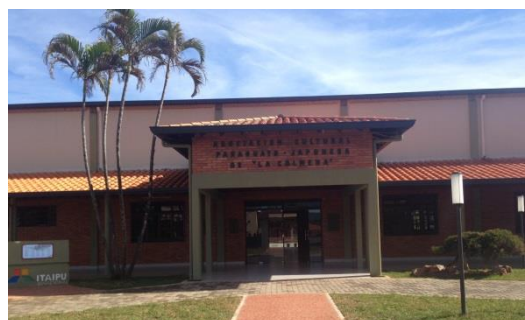
ラ・コルメナパラグアイ日本文化協会正面玄関

ラ・コルメナパラグアイ日本文化協会では、会員相互の親睦を計り、文化、体育、教育の向上、日本・パラグアイ人間の文化、経済の交流、福祉の増進、厚生、擁護等を計り、地域社会の発展に寄与し、日本・パラグアイ間の親善を計ること目的に、以下のような活動を行っています。