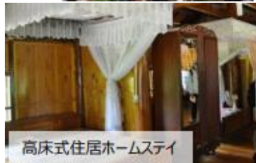
高床式住居ホームステイ