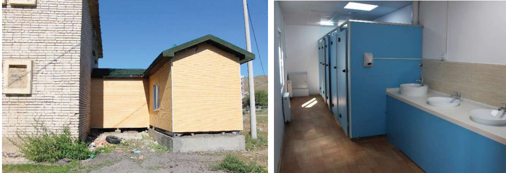
第 85 番学校の建物の離れにあるトイレ（2017 年）