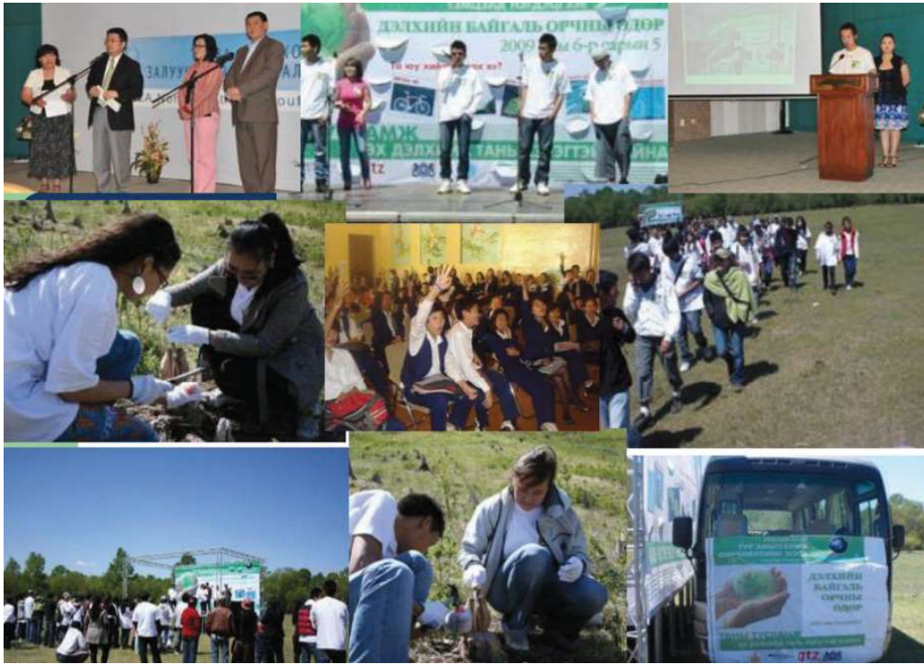
国連自然環境計画の TUNZA 北東若者自然環境ネットワーク国際会議