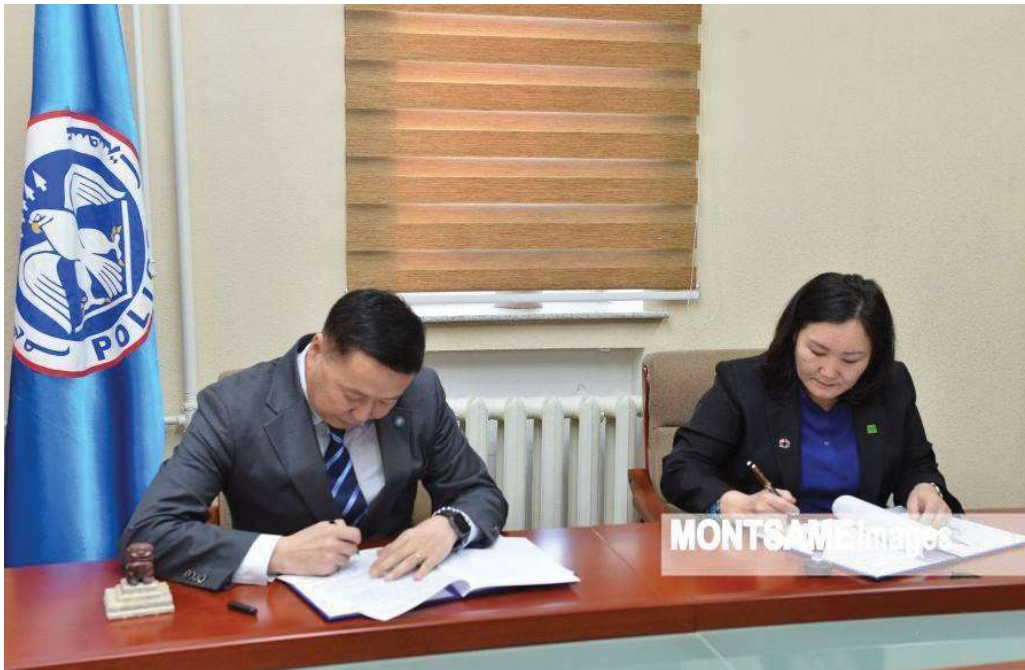
エコロジー警察局と全国規模協力契約に署名（2020年）