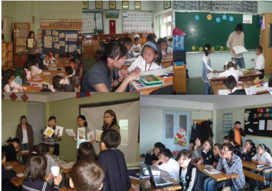
持続可能な開発教育、自然環境保護についての学習セミナー