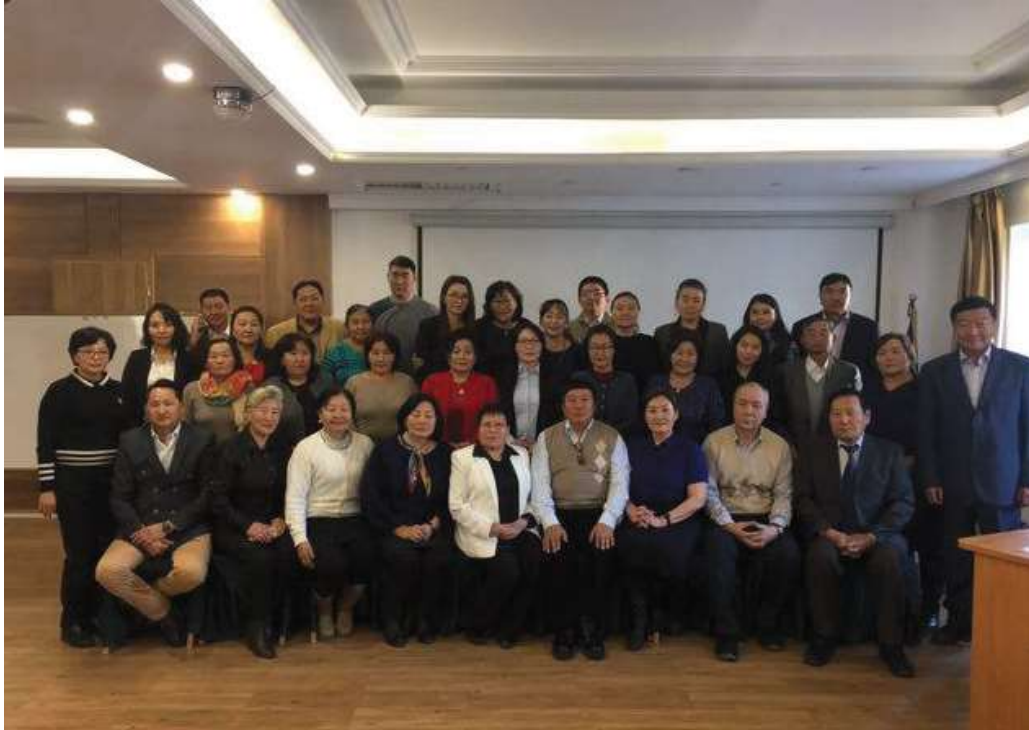
グリーン議会議員（2019～2021年）

モンゴル自然環境国民委員会が自然環境観光省と共同で2018～2019年にウランバートル市の大気汚染削減事業を提唱し、開催しました。