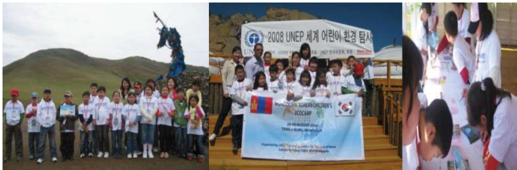
Монгол – Солонгосын Хүүхдийн зуны ЭКО зуслан, Тэрэлж, 2008