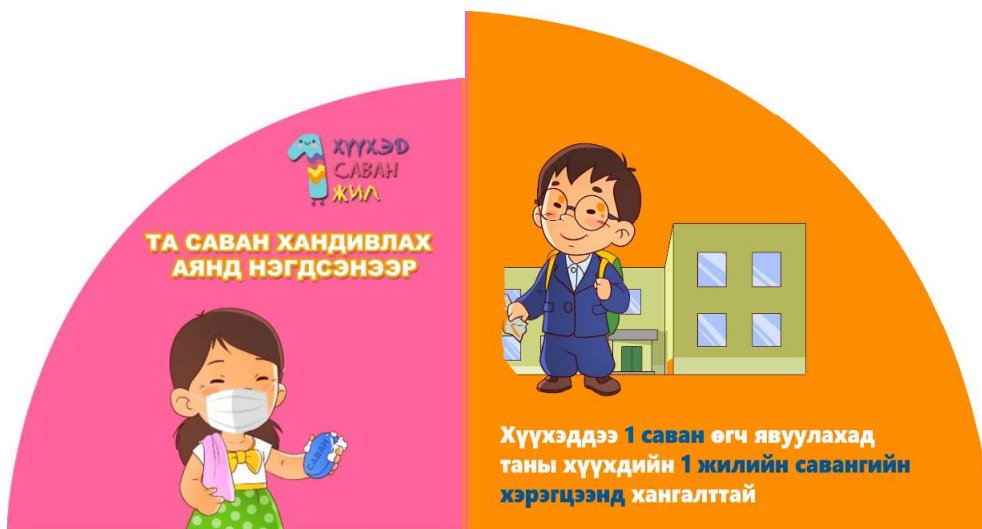
学校における石鹸寄付キャンペーン資料（2020）