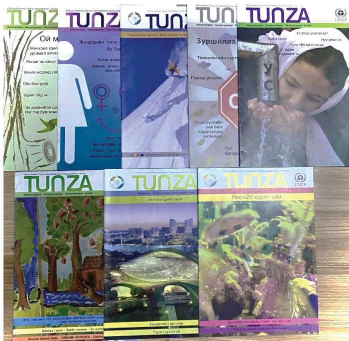
国連自然環境計画のTUNZA 雑誌をモンゴル語に訳して配布