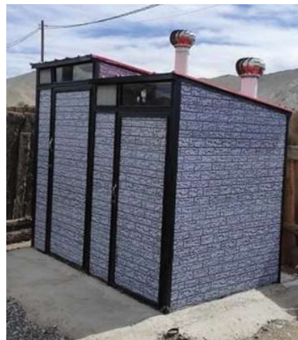
各家庭のトイレを 2 つに分け、子どもが使いやすいようにしました。(2020 年、パヤンホンゴル県)