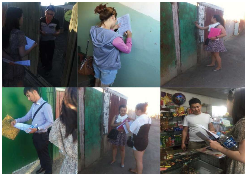
持続可能な開発、自然環境と社会の健康に関する調査