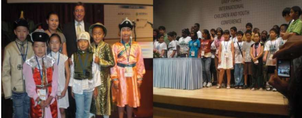
НУББОХ-ийн Олон улсын хүүхдийн хурал, Тэжон, БНСУ, 2009