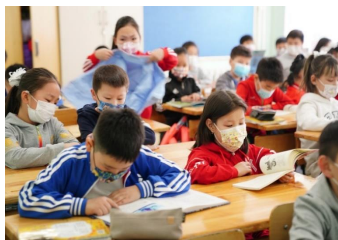
Сурагчид номоо уншиж байгаа нь.