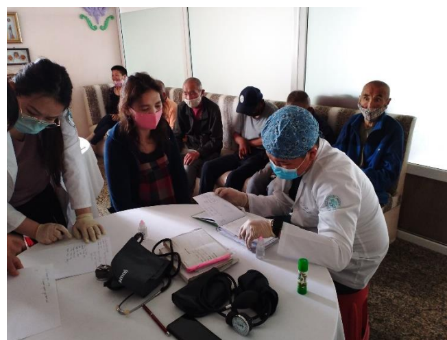
Асруулагчдаа тогтмол эрүүл мэндийн үзлэг шинжилгээнд хамруулж байна.