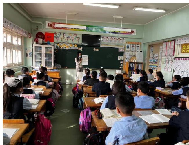
Өдрийн тэмдэглэлийн аянд зориулж ангиудаар танилцуулга хийв.