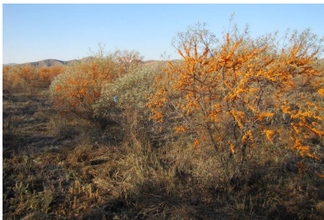
Зураг 1. Чацарганы тариалан