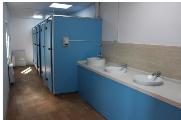
Зураг 2: БЗД-н 85-р сургуулийн барилгад залгаж барьсан ариун цэврийн байгууламж, 2017 он