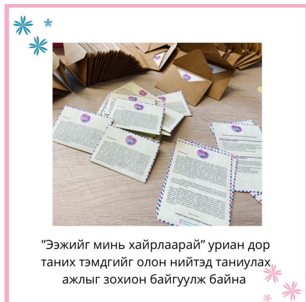
"Ээжийг минь хайрлаарай" уриан дор таних тэмдгийг олон нийтэд таниулах ажлыг зохион байгуулж байна