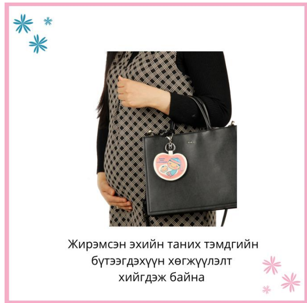
Жирэмсэн эхийн таних тэмдгийн бүтээгдэхүүн хөгжүүлэлт хийгдэж байна