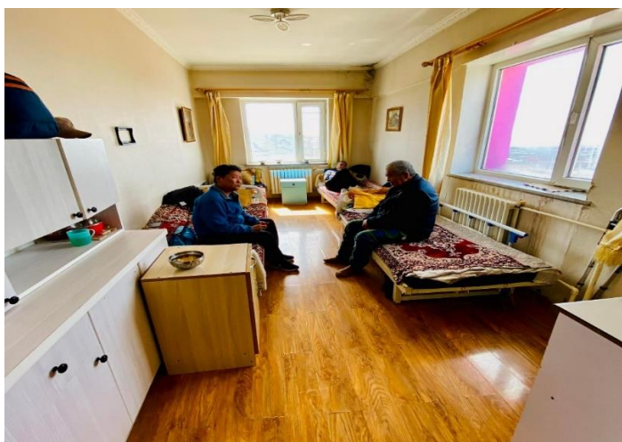
Тус төвд өнөөдрийн байдлаар ХБИ болон ахмад настай 60 асруулагч асруулж байна.