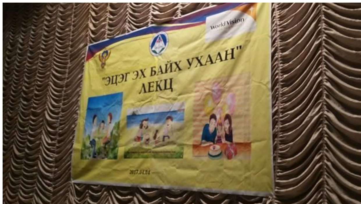
“Дэлхийн Зөн” ОУБ-тай хамтран “Эцэг, эх байх ухаан” лекцийг үе шаттай зохион байгуулав. Улаанбаатар, Баян-Өлгий аймаг, Завхан аймаг, Хэнтий аймаг 2017 он