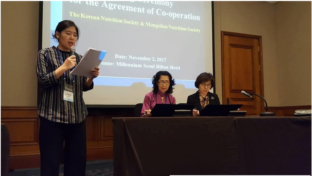
KNS and MNS the ceremony of MOU