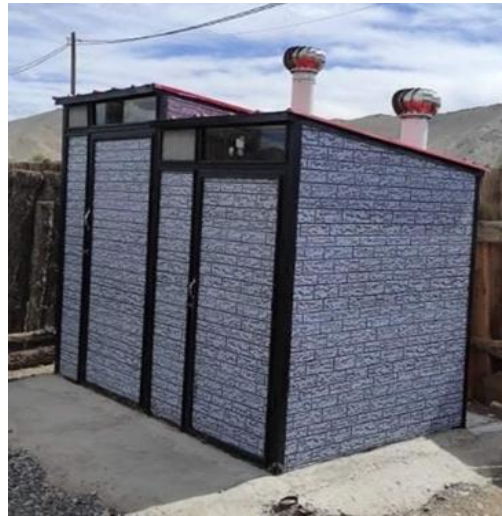
Зураг 1: Өрхийн ариун цэврийн байгууламжийг 2 тасалгаат, хүүхдэд ээлтэй байдлаар шийдсэн нь. 2020 онд Баянхонгор аймгийн төвд