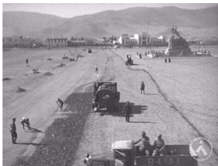
Монгол улсын төв талбай. 1946 он