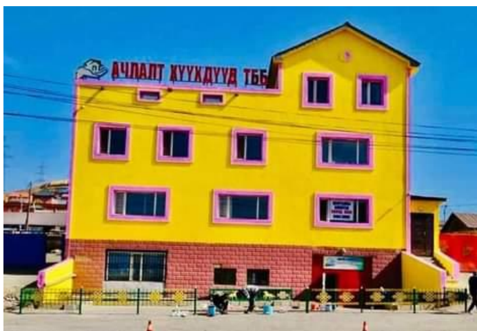
СХД-ийн 28-р хороо ТББ-ын байр