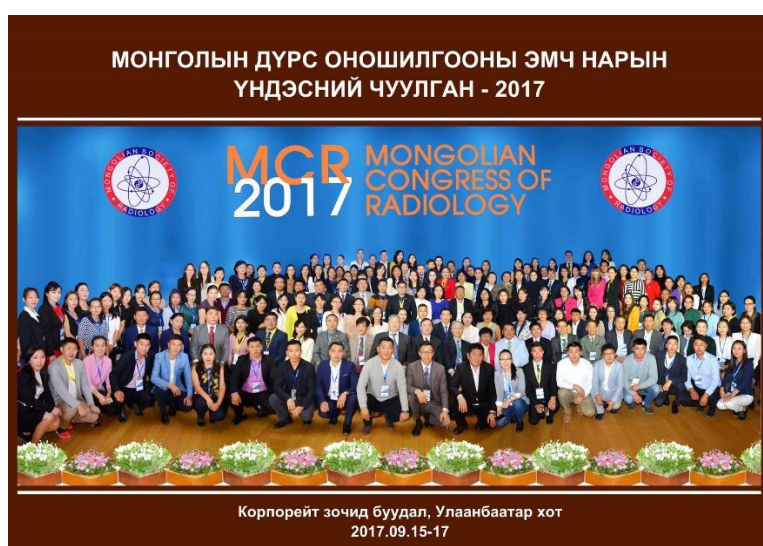
Зураг 2. Монголын дүрс оношилгооны эмч нарын үндэсний чуулган