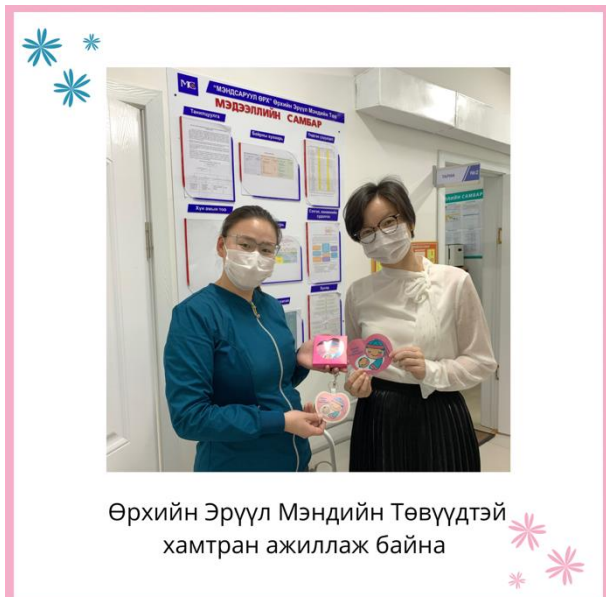
Өрхийн Эрүүл Мэндийн Төвүүдтэй хамтран ажиллаж байна