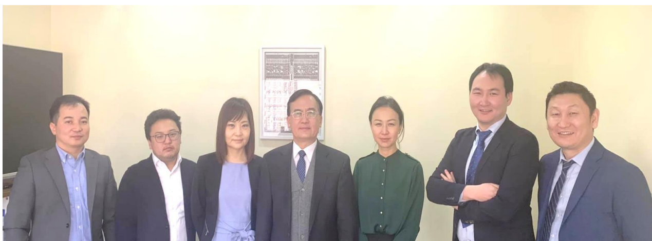
Зураг 1. Ковидын дүрс оношилгоо сэдэвт цахим сургалтын сургагч багш нар