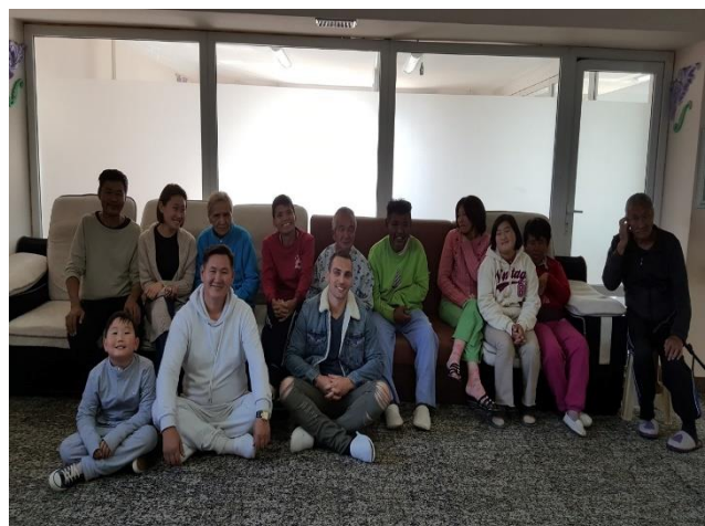
Асрамжийн газарт ирсэн сайн дурын ажилтнууд асруулагчидын хамт