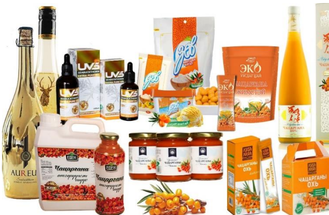
Зураг 2. Чацарганы бүтээгдэхүүн