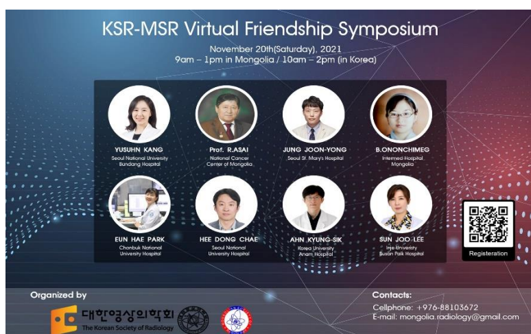
Зураг 3. Солонгос-Монголын радиологийн нийгэмлэгийн хамтарсан хурал