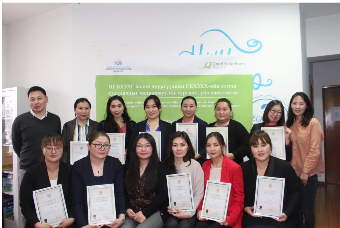
Good neighbors ОУБ-тай хамтран тэдний зөвлөгч мэргэжилтэнүүдийг “Зөвлөгөө өгөх ур чадвар”-ын сургалтанд хамруулж гэрчилгээ олгов. Улаанбаатар 2017 он