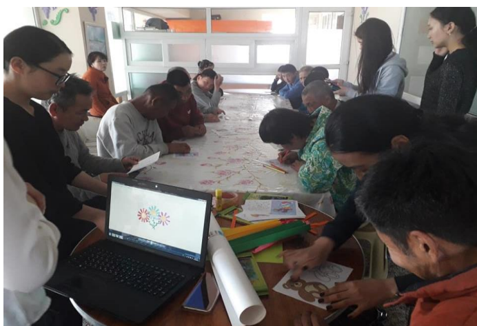
Асруулагчидын хөгжлийн ажиллагаа / зургийн хичээл /