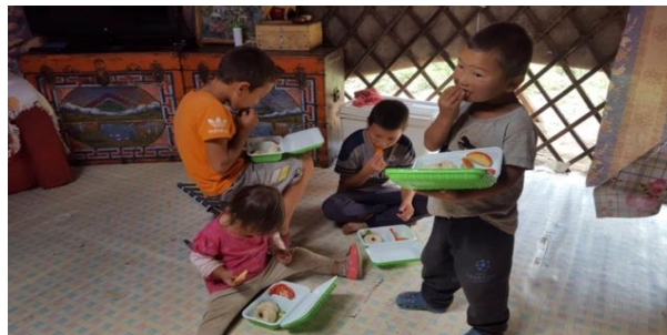
Зураг 3. Төслөөр хүүхдүүд хүнс тэжээлийн дутагдалд өртөхөөс сэргийлэх зорилгоор зорилтот өрхийн 612 гишүүнд халуун хоол, хүнс хүргэж өгсөн.