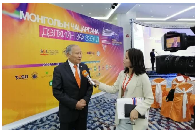
Зураг 4. Монголын чацарганы кластерийн анхдугаар чуулган. 2020 он