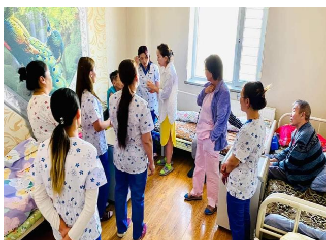
Асрамжийн төвийн асаргааны ажилчид