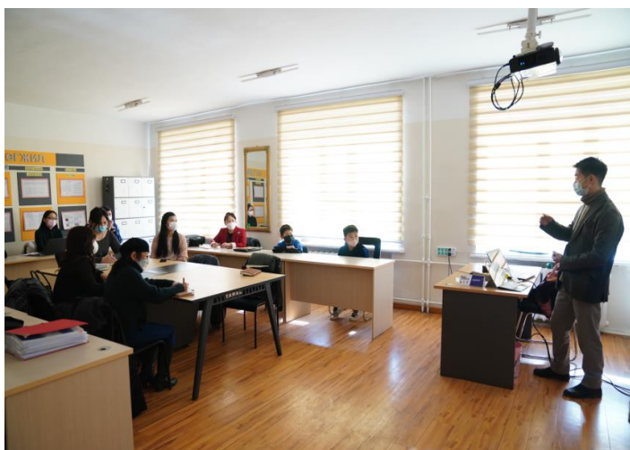
Япон улсын заах арга барилын талаар багш, ажилчидтай цуврал семинар хийж байна.