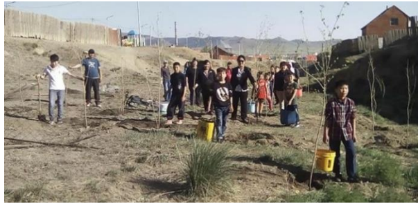
Зураг 1. Жил бүрийн 5 сард зохион байгуулдаг “Ногоон хороо” аяны үеэр иргэдэд мод тарих, орчноо тохижуулах ажлыг орон нутгийн эко бүлгийн хүүхдүүд манлайлан хийдэг.

nutritional balance”) 2020 онд хэрэгжүүлсэн. Бид Сонгино Хайрхан дүүрэг (СХД)-ийн Толгойт бүсийн 1, 3, 4, 26, 35, 36-р хорооны сонгосон 96 өрхийн хүнсний хэрэглээ, шим тэжээлийн нөхцөл байдлыг судлахын хамтраар КОВИД-19 цар тахалын үр нөлөөнөөс үүдэн эмзэг бүлгийн өрхийн гишүүд, ялангуяа хүүхдүүд хүнс тэжээлийн дутагдалд өртөхөөс сэргийлэх зорилгоор зорилтот өрхийн 612 гишүүнд хоол, хүнс хүргэх богино хугацааны төслийг 2020 оны 7-р сарын 7-ноос 9-р сарын 18 хүртэлх 11 долоо хоногт хийж гүйцэтгэсэн. Энэхүү богино хугацааны төслийн зорилго нь i) “Хөдөө аж ахуйн салбарын нэмүү өртгийн мастер төлөвлөгөө боловсруулах туршилтын төсөл”-д хувь нэмэр оруулах, ii) КОВИД-19 цар тахалын үр нөлөөнөөс үүдэн эмзэг бүлгийн өрхийн гишүүд, ялангуяа хүүхдүүд хүнс тэжээлийн дутагдалд өртөхөөс сэргийлэх, iii) Хоол, хүнс хүлээн авсан өрхүүдийн хүнсний хэрэглээ, шим тэжээлийн нөхцөл байдлыг тодруулахад оршсон. Төсөл нь ядуурлын тойргоос гарч чадахгүй байсан, КОВИД-19 цар тахалын үед ажил орлогоо алдаж улам хүнд байдалд орсон өрхийн санхүүд дэмжлэг болж, бүх нас, хүйсийн хүний эрүүл мэнд, сэтгэл санаа болон гэр бүлийн гишүүдийн харилцаанд эерэг өөрчлөлт авчирч чадсан. Төслийн хүрээнд өрхийн хүнсний хэрэглээ, шим тэжээлийн нөхцөл байдлын талаарх судалгааг 3 удаагийн давтамжтай 96 өрхийн 612 хүнийг хамруулан хийсэн.