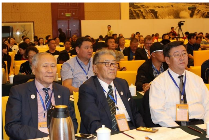
Зураг 3. ОУ-ын Чацарганы холбооны VII чуулганы үеэр. БНХАУ. 2019 он