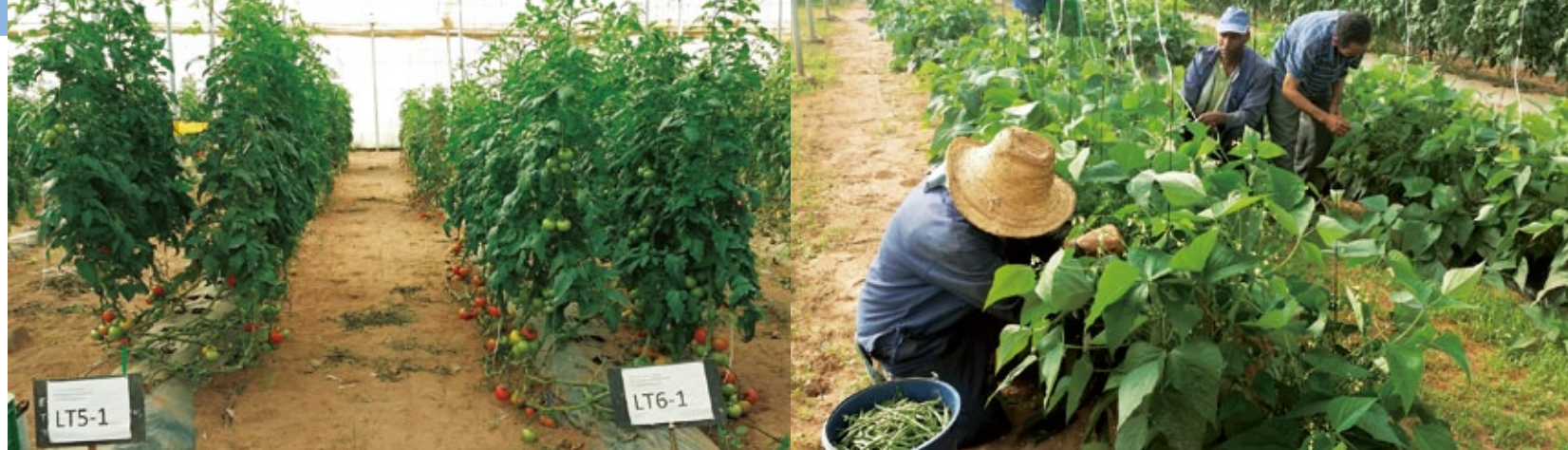
試験圃場で栽培したトマト。左が現地一般的な土壌、右がポーラスαを導入した土壌で、 右のほうが生育状況がいいことがわかる

鳥取銀行入行後、ソイル工学 取締役を経て、2003年7月に 鳥取再資源化研究所取締役 就任。2006年3月より代表取 締役。